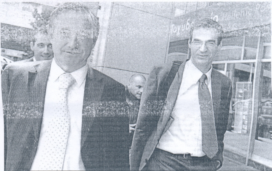
Los 'rescatadores' de Grecia. Miembros de la misión tripartita del FMI, la Comisión Europea y el Banco Central Europeo abandonaron ayer el Ministerio de Finanzas de Grecia tras la primera reunión con el Gobierno heleno

"Lo que ha contribuido principalmente es un crecimiento muy débil fruto de la crisis", explicó el economista del FMI. Para solucionar esa situación, España necesita,