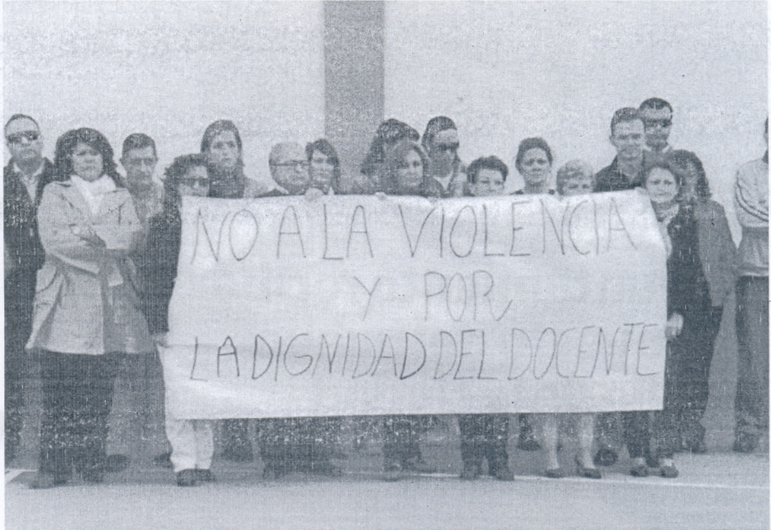
El claustro de profesores del colegio Luis Ponce de León ayer en la concentración silenciosa en repulsa de la agresión a su compañero.

Los hechos se producían cuando, el pasado 15 de abril, el profesor se veía obligado a intervenir en una pelea entre dos alumnos, uno de ellos el hijo del presunto agresor, para separarlos. Un hermano mayor del alumno observaba la escena y se encaró con el profesor advirtiéndole que se lo diría a su padre. A la hora de la salida de las clases, el padre entraba en el centro buscando al profesor, y sin mediar palabra, le agarró de forma violenta por la espalda, para