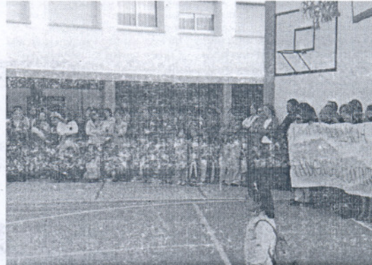
Muchos padres secundaron a los docentes durante este acto.

El claustro tiene en mente poner en marcha una serie de medidas como respuesta a este hecho, que incluyen la suspensión de las actividades extraescolares, e incluso la no celebración de la fiesta de fin de curso. "Así queremos concienciar a los padres y dar a entender que comportamientos como éste nos perjudican a todos". Estas actividades serán estudiadas en el Consejo Escolar, ya que requieren el apoyo del AMPA del colegio. Incluso se baraja la posibilidad de hacer un día de paro de clases y una manifestación en la que se impliquen el resto de centros escolares del municipio.