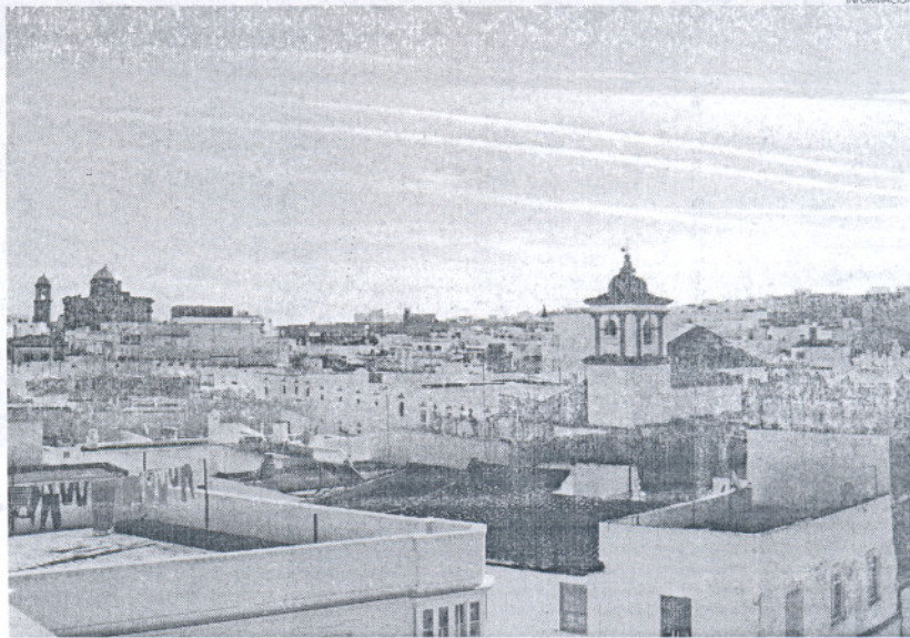
Chiclana es uno de los municipios que pueden acogerse a estas ayudas de Medio Ambiente.

El principal objetivo de la Orden es subvencionar acciones que contribuyan a la implantación de las Agendas 21 Local en los municipios adheridos al programa para afrontar los principales problemas medioambientales de dichas localidades. Las acciones y proyectos subvencionables son aquellos que se adecuan a los principios e indicadores básicos de Ciudad 21: gestión sostenible de los residuos urbanos, gestión del agua, fomento del ahorro energético y uso de las energías renovables, contaminación acústica y su prevención, entre otros.