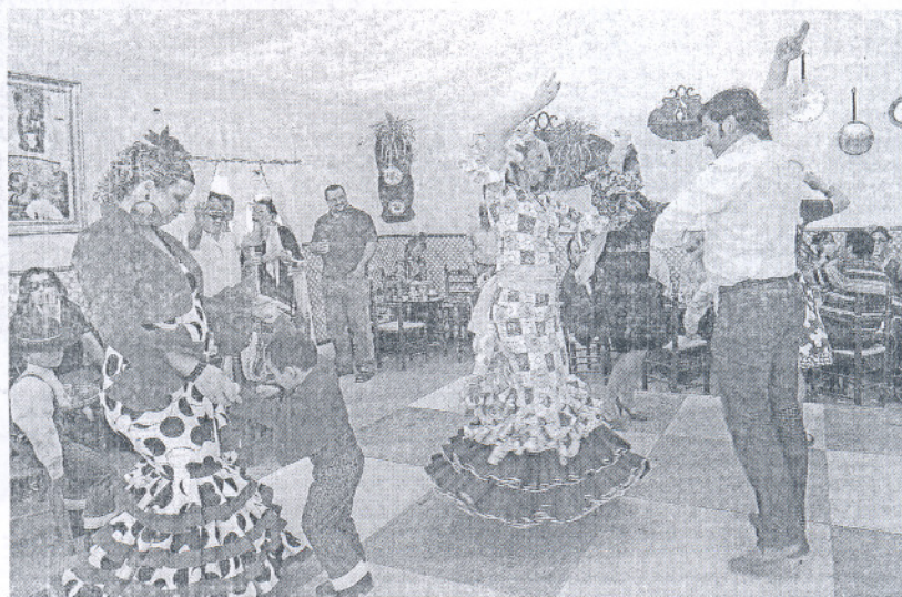
Una instantánea del buen ambiente que se respiraba ayer en el Real de la Feria de Primavera.

La Feria de Primavera también es elegida cada año para anunciar la próxima Urta de Oro, que se entrega en la Fiesta de la Urta, allá por el mes de agosto. En esta ocasión, como se encargó de difundir el propio alcalde, Lorenzo Sánchez, el reconocimiento será para Onda Cero Radio, según la decisión tomada por el jurado de la denominada Orden de la Urta de Oro, reunida en el pabellón municipal. Sánchez subrayó "el trabajo que viene haciendo esta cadena de radio en la localidad, donde ya ha cumplido veinte años", destacando especialmente "la promoción que ha hecho del municipio".