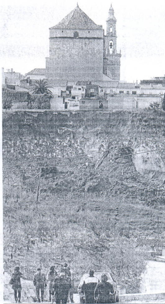
El derrumbe de una ladera destruye un paseo en Santaella (Córdoba).