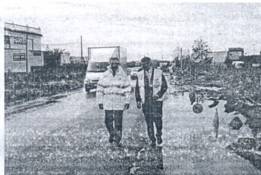
El delegado provincial de Obras Públicas y el alcalde visitaron la zona.

Como es sabido, la A-491 está siendo objeto de reforma en distintas fases para "mejorar las conexiones de la Costa Noroeste con la Bahía de Cádiz", según des-