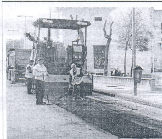
La Avenida de la Constitución, en obras durante la jornada de ayer.

En una visita que realizó al vivo municipal, "recuperado" con un coste de casi 8.500 euros, la alcaldesa explicó que esta actuación forma parte del nuevo plan del Consistorio, pues permitirá