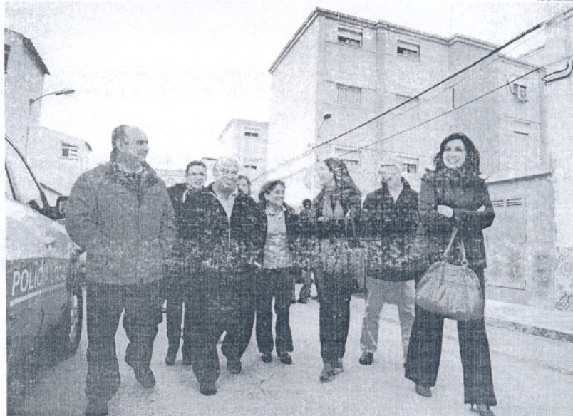
Los arreglos a los que se está sometiendo la barriada garantizan un cambio a mejor notable en los edificios.