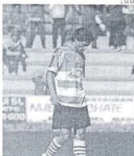
Piñero en su etapa verdiblanca.

DERBI La semana terminará este domingo con el tercer encuentro liguero de la semana. El Cuvillo puede acoger la cuarta victoria consecutiva lo que supondría alcanzar la mejor renta con cuatro partidos vencidos. La cita ante el Puerto Real empezará el domingo a las 5 de la tarde.