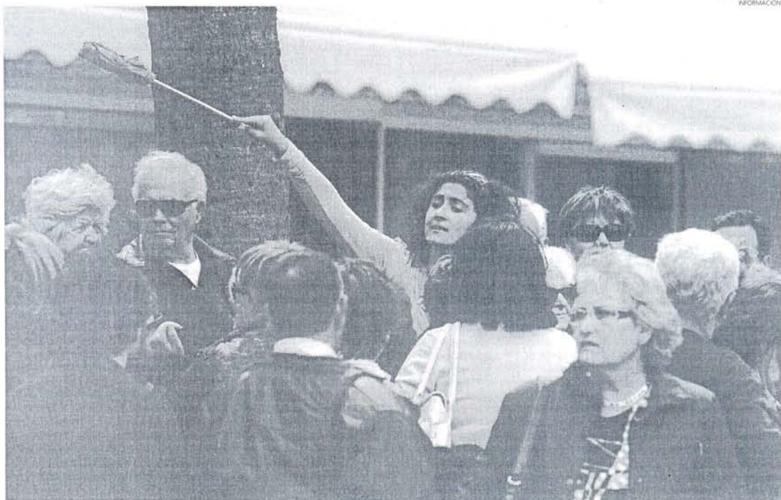
El mal tiempo y la crisis de los controladores fue determinante para las cifras de ocupación hotelera registradas.

Esta falta de ocupación de plazas de hotel en la provincia ha causado un quebranto económico a los hoteles que va a ser analizado en una próxima reunión del consejo de administración de la entidad para estudiar los pasos a seguir en una posible reclamación