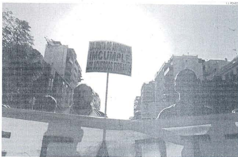
Los ex trabajadores portaban pancartas denunciando que la Junta "incumple los acuerdos firmados".

El hecho de que la marcha contara con poco más de mil personas, pone en evidencia también que este colectivo está perdiendo el apoyo de la ciudadanía. Los cortes en carreteras y el las vías férreas no ayudan a mejorar esta relación, como tampoco ayuda que en los últimos tres años, el paro en la provincia afecte ya casi a una de cada tres personas en edad de trabajar. Lo cierto es que en la página web de este medio, los comentarios negativos ganaron por goleada a los de apoyo.