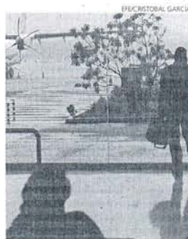
Afectados por el caos aéreo.

Además, Facua ha enviado un correo electrónico a todos los miembros de la plataforma para