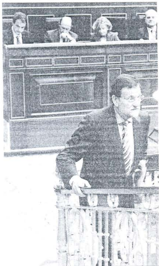
Rajoy, tras su intervención en el Congreso de los Diputados.

JUSTICIA El presidente asegura que la legislación vigente ofrece resortes suficientes para sancionar penalmente lo sucedido