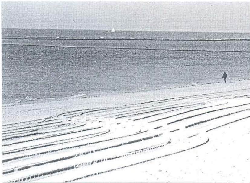
La playa de Los Corrales, de Rota, donde se produjo la agresión sexual de marzo de 2006.

La Audiencia juzgará el próximo martes por dos agresiones sexuales al hombre que fue condenado en 1999 por un caso similar a los que luego hubo durante años