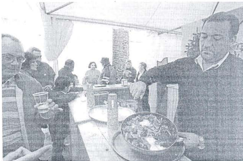
La II Feria Solidaria de los Vinos y la Tapa de Chipiona se celebra estos días en la plaza Juan Carlos I.

La fiesta gastronómica de Chipiona, que se reanuda esta misma noche en la céntrica plaza Juan Carlos I, fue inaugurada el pasado viernes por el ex futbolista Rafael Gordillo en calidad de padrino del acontecimiento. La programación fijada para los días del puente incluyó actuaciones musicales, desfiles de moda y concursos gastronómicos, uno de ellos de tortillas a beneficio del colectivo local contra el cáncer y la asociación chipionera de familiares de enfermos de alzheimer.