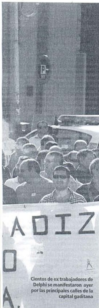
Cientos de ex trabajadores de Delphi se manifestaron ayer por las principales calles de la capital gaditana

por el mantenimiento de los cursos de formación, el cumplimiento del Plan Bahía Competitiva y que no se vendan los antiguos terrenos de Delphi.