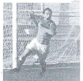
El gol de la permanencia.

Si hay un rival que acude al José del Cuvillo con un bagaje tan negativo y casi derrotado de ante mano, es el Puerto Real. Si nos atenemos a los datos y a la cantidad de enfrentamientos que ambos han dilucidado a lo largo de su historia, los números demuestran unos guarismos cuanto menos aclaratorios y radicales. De los 22 enfrentamientos disputados ante los racinguistas en suelo portuense, en 16 ocasiones terminaron perdiendo. Pocos derbis disputados entre equipos provincianos alcanzan unos balances tan marcados y tan favorables para los intereses rojiblancos. El primer choque celebrado entre Racing Portuense y Puerto Real, en Tercera División, data de la temporada 56-57 cuando vencieran en el extinto Eduardo Dato. Los racinguistas acabarían la Liga tercero tras Coria y Recreativo de Huelva. Entre las goleadas sona-