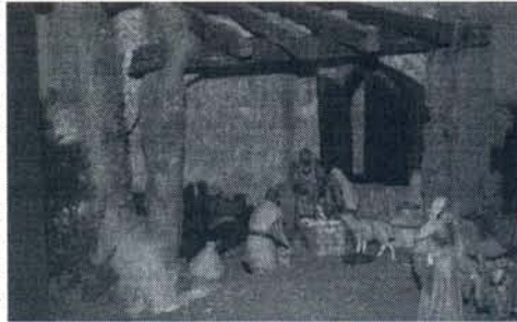
Belén de la asociación de belenistas inaugurado el miércoles

La asociación de belenistas de Rota "Camino de Belén" vivió en la tarde del pasado 8 de diciembre un día muy importante, ya que desde el miércoles cuentan con una sede en la que poder reunirse y llevar a cabo las distintas actividades que organizan. Contar con una sede propia, ubicada en el centro cívico recién inaugurado de El Molino, es todo un logro para esta asociación que pretende seguir creciendo y sobre todo, mantener las tradiciones más arraigadas en Rota como el montaje de belenes en Navidad.