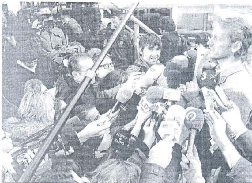
El portavoz de los controladores, rodeado de periodistas a su llegada, ayer, a la Audiencia de Madrid.

Según informaron fuentes de la Fiscalía General, las investigaciones practicadas en cada uno de los territorios donde hay aeropuertos con controladores civiles derivarán en denuncias ante sus respectivos órganos judiciales.