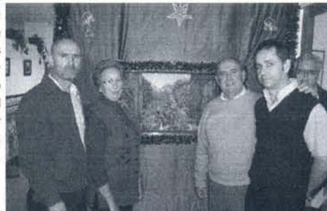
Los delegados municipales, la presidenta de los mayores y el autor del belén del "Cristina Buada"

Entre las distintas actividades que tienen previsto desarrollar en esta época navideña, la asociación de belenistas "Camino de Belén" ha convocado para el próximo sábado 18 de diciembre una ruta belenista en la que los interesados sólo tienen que acudir a las seis de la tarde a la sede ubicada en la calle Sargento Céspedes Local 15 (junto al pabellón Manuel Villalba). La ruta consistirá en un recorrido por aquellos belenes más significativos de la localidad montado por asociaciones, peñas, bares, entidades y particulares.