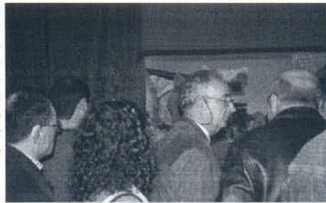
Muchos ciudadanos acudieron a la inauguración de la nueva sede

Durante el acto, que contó con la presencia de todos los socios, de miembros de la Corporación municipal y de muchos ciudadanos, se pudo visitar el primer belén que monta esta asociación cuyas figuras han sido realizadas por el escultor jerezano Joaquín Pérez. El belén, en el que se han implicado todos los socios, está abierto al público para ser visitado hasta el próximo 4 de enero de seis de la tarde a nueve de la noche.