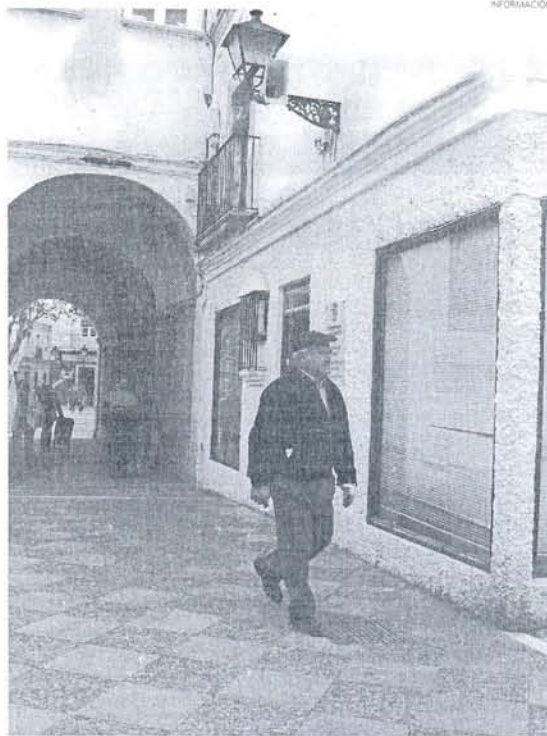
Imagen de la fachada de la Oficina Municipal de Información al Consumidor.

Con respecto a la utilización del logotipo de la Junta que los trabajadores llevan serigrafiado en sus uniformes, desde la OMIC se informa, que su utilización, "está provocando bastante confusión" entre los propios usuarios, por lo que la OMIC considera que "su utilización pudiera ser fraudulenta dado que no tienen ningún autorización por parte de la Consejería de la Presidencia ni de la Consejería de Innovación y Ciencias, para utilizar el mismo", ya que según la versión de algunas personas afectadas, manifiestan "que les han dejado entrar en sus do-