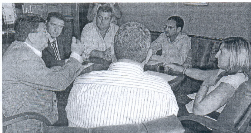
Los cuatro alcaldes y otros políticos locales, reunidos ayer en el Palacio Municipal de Sanlúcar.

Los alcaldes de los cuatro municipios abordan la puesta en marcha del nuevo canal de televisión con sede en Sanlúcar