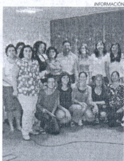
El delegado con algunos alumnos.

Los participantes han tratado temas sobre la prevención, retraso y disminución del consumo de sustancias tóxicas tanto legales como ilegales en la población juvenil.