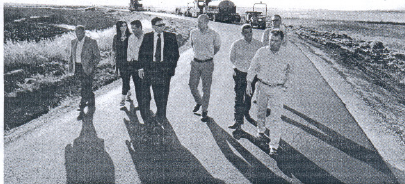
El alcalde de Rota y el presidente de la Comunidad de Regantes visitaron el camino de Gamonales.

La visita a estas obras que corresponden al proyecto de mejo-