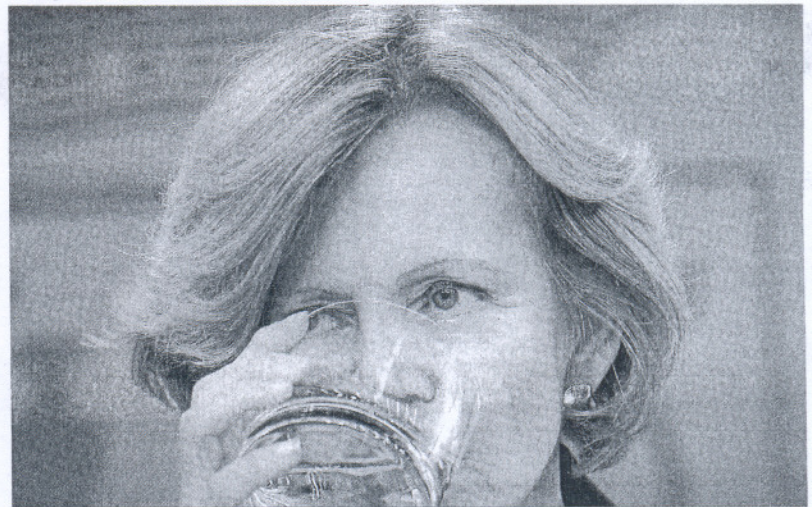
La ministra de Economía, Elena Salgado, en la rueda de prensa posterior al Consejo de Ministros de ayer.

El ajuste hará más lenta la recuperación. Aunque se mantiene una previsión de caída económica del 0,3% para este año empeoran las estimaciones de crecimiento de los tres siguientes: el 1,3% en 2011 -como ya se anunció la semana pasada-, el 2,5% en 2012 y