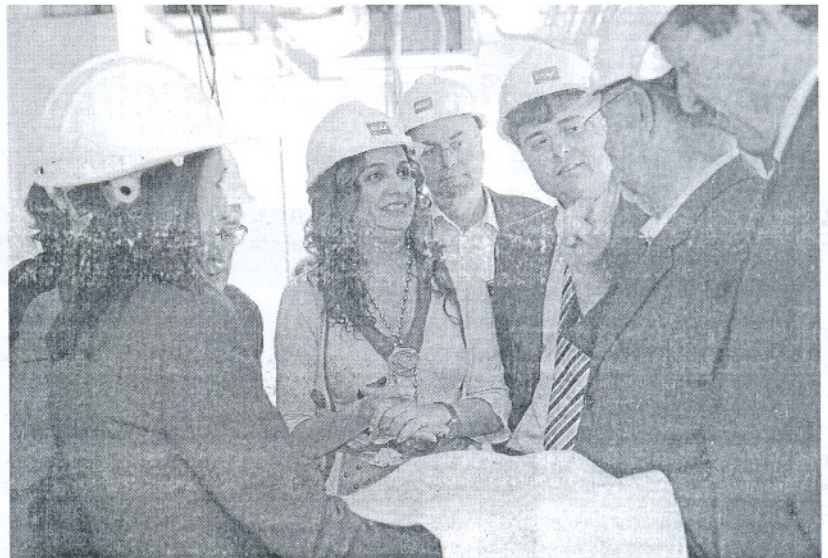
La consejera analiza con los técnicos y alcaldes de la zona el proyecto del Chare de la Janda.

Por dentro, el avance también es importante, gran parte de la solería ya está colocada, los revestimientos de las paredes, los falsos techos de escayola, las conducciones para el aire acondicionado, así como metros y metros de cables de diferentes colores y con muy diversos cometidos. También se encuentran colocadas las puertas de los ascensores, y apiladas a la en-