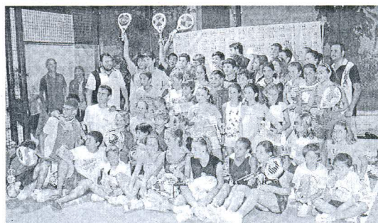
Algunos de los participantes del Torneo Padelmanía de El Puerto.