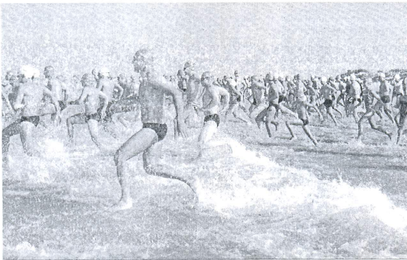
Los nadadores corren para adentrarse en el mar al comienzo de la prueba.

NATACIÓN • Travesía de la playa de la Costilla