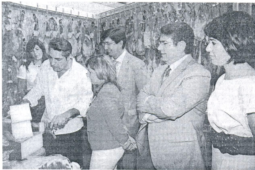
Un momento de la jornada inaugural de la pasada edición de la Feria del Comercio y la Empresa de Sanlúcar.

La segunda edición será del 30 de septiembre al 3 de octubre en Las Dunas