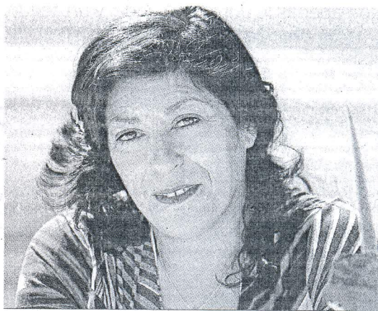
La escritora Almudena Grandes.

noche a la literatura será la Plaza de la Merced, en lugar de en la tradicional plaza de Bartolomé Pérez. Este nuevo emplazamiento, concedido por el Ayuntamiento de Rota, no ha sido del agrado de la organización, que lo considera como “una plaza desolada,