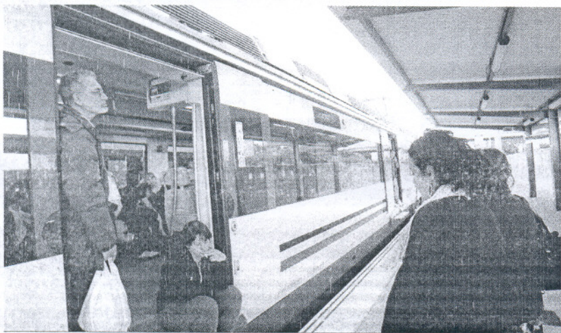
Pasajeros a la espera de la reanudación del servicio ayer por la tarde en Las Aletas (Puerto Real).