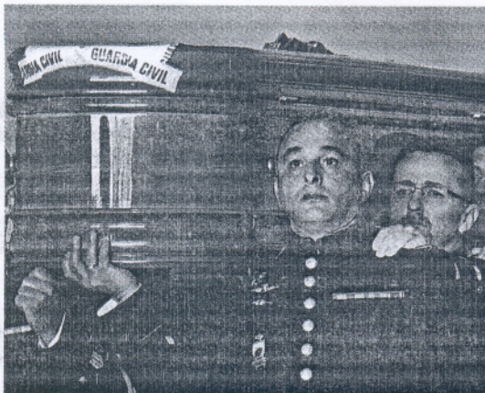
Los féretros fueron llevados a hombros por los propios compañeros.

Del Río destacó el ejemplo de "nobleza, generosidad y solidaridad" de los cuatro marinos de la Armada que el pasado 22 de enero, junto a 400 más, salían en el buque Castilla desde la misma Base que ahora le daba la despedida definitiva. "Ellos partían con la ilusión de ayudar a un pueblo devastado y perdieron sus vidas en la hermosa tarea de devolver a un pueblo su dignidad", dijo el arzobispo castrense en su homilía. Juan del Río consoló a las familias