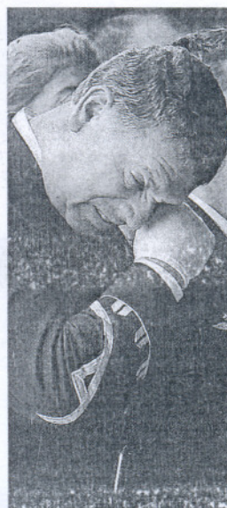
El llanto de un marino.

"Salve, estrella de los mares; de los mares iris de eterna ventura". Y el arzobispo castrense, Juan del Río, pide a la Patrona de la Armada que interceda por los cuatro fallecidos, apenas unos minutos antes de que el Rey imponga a cada uno de ellos la Cruz al Mérito Naval con distintivo amarillo.