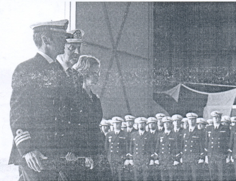
Los Reyes de España, momentos antes de dar el pésame a los familiares de los marinos fallecidos.