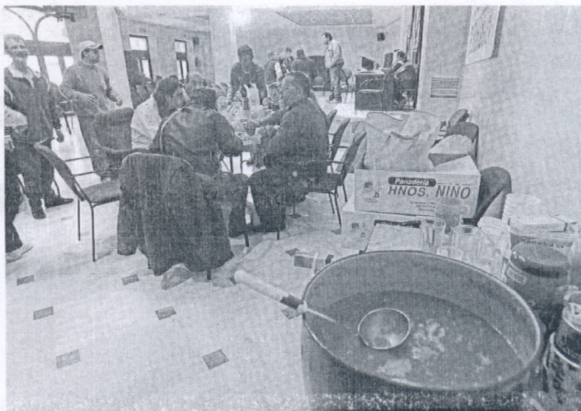
Una imagen de archivo de los trabajadores encerrados en la casa consistorial del Castillo de Luna.

"Pero, ¿les ha ofrecido empleo?", pregunta este periódico.