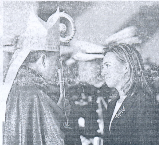
El arzobispo castrense conversa con la ministra de Defensa.