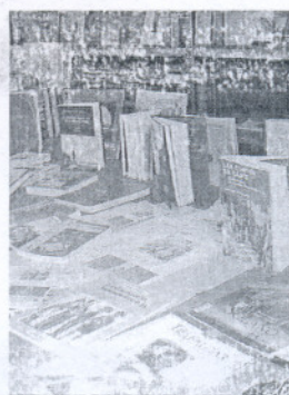
Feria del libro.

Los objetivos de la actividad son estimular los sentidos a través de las palabras, los olores y los sabores; compartir los cuentos, los alimentos elaborados y la emoción y recuperar el asombro y los recuerdos que se esconden en los relatos.