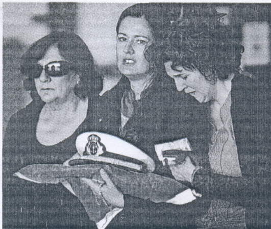
Familiares de uno de los marinos, con la gorra y la bandera.

Sobre las diez y media de la mañana, con una marcha fúnebre y a