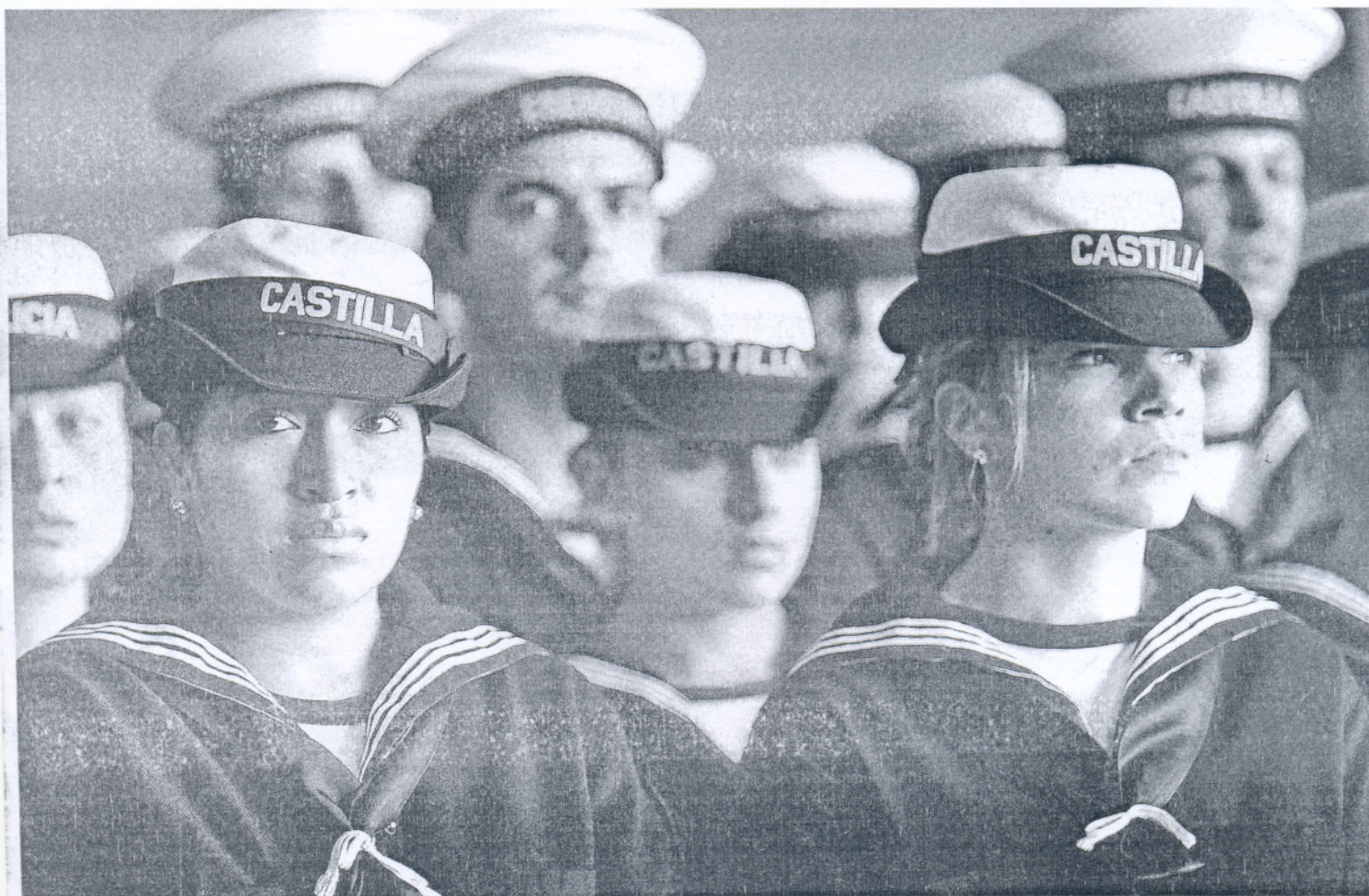
Caras serias durante el funeral de algunos componentes de la dotación del 'Castilla' que no están participando en la misión humanitaria en Haití.

HASTA LA BANDERA El funeral se llevó a cabo en un hangar del aeropuerto de la Base con la presencia de centenares de militares