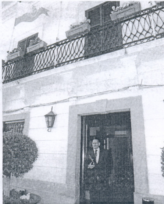
Entrada del Ayuntamiento de San Roque.

La capital gaditana, curiosamente, ocupaba el primer lugar