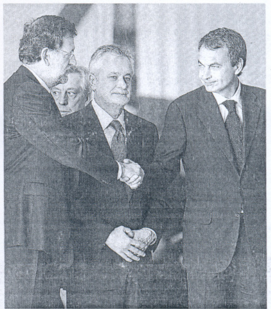
Mariano Rajoy, José Antonio Griñán y José Luis Rodríguez Zapatero.