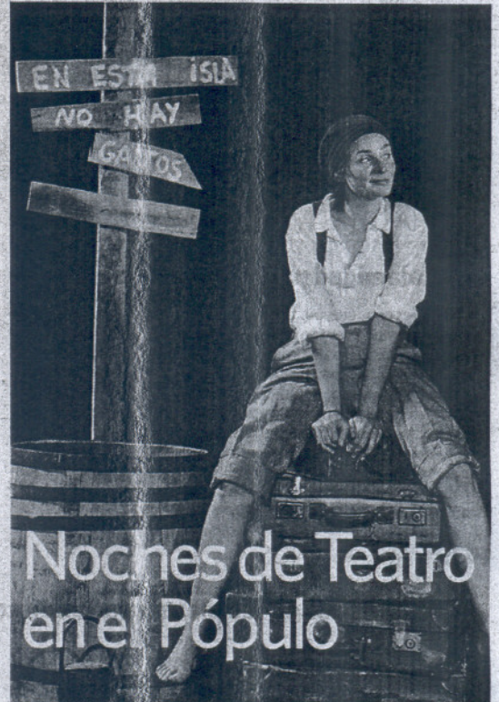
Obra de la compañía "Tras el Trapo Teatro".

'CÁDIZ Y EL NUEVO MUNDO' CASTILLO DE CHIPIONA Centro de interpretación que repasa la relación de la provincia con el Descubrimiento, la Colonización y la Explotación del Nuevo Mundo. Abierto de martes a viernes, de 10.00 a 14.00 y de 17.00 a 19.00 horas. Sábados, domingos y festivos, de 10.00 a 14.00 horas.