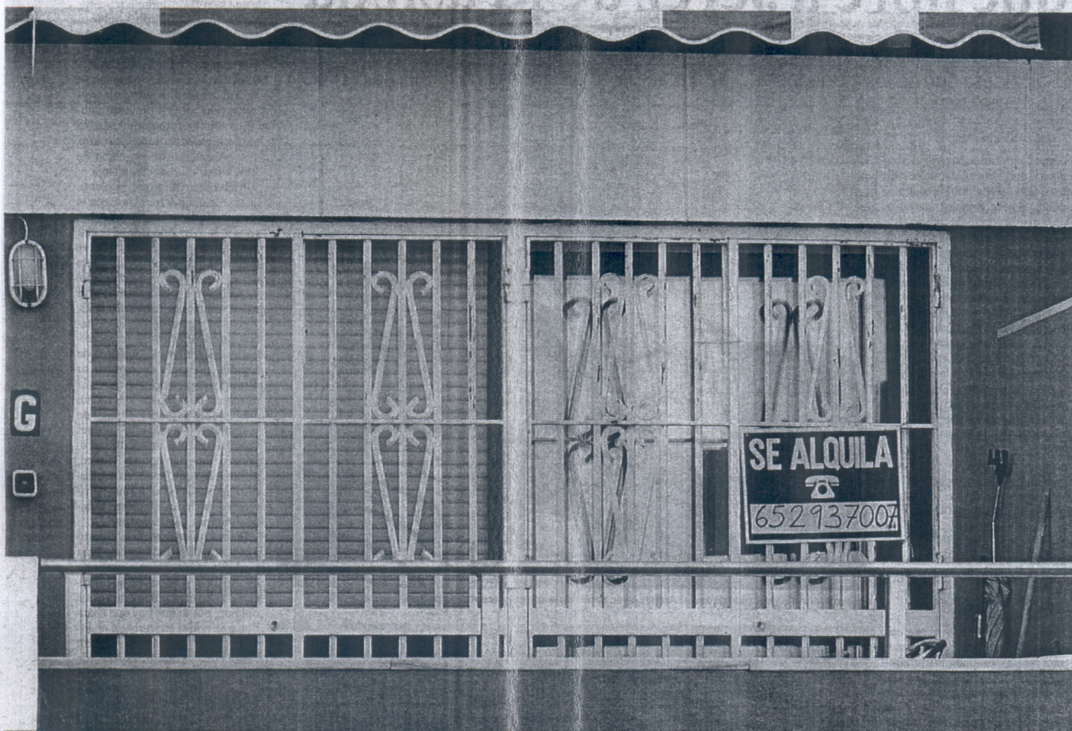
Un hombre entra en una vivienda de primera línea de playa que luce en su ventana una oferta de alquiler.

Apartamentos que hace dos años estaban apalabrados desde el mes de mayo hoy aún están sin arrendar