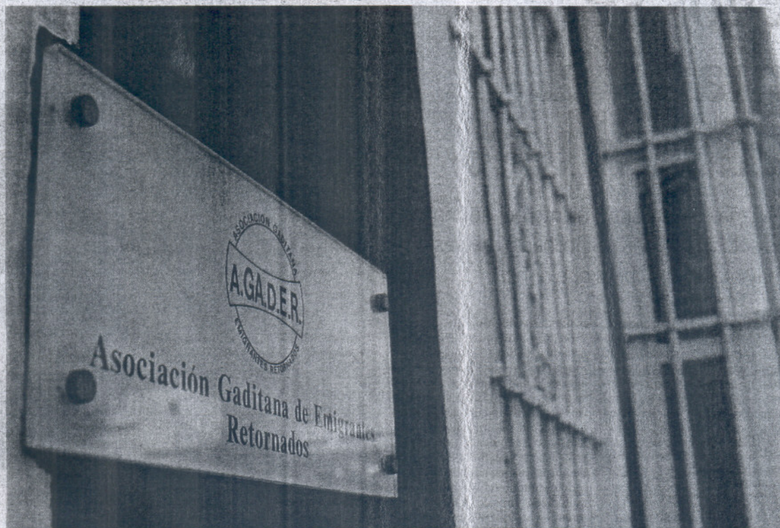
Fachada del local de la Asociación Gaditana de Emigrantes Retornados, cuya sede se ubica en San Fernando.