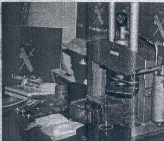
Droga y efectos intervenidos a la red de tráfico de cocaína.

Agentes de Policía Judicial de la Comandancia de Cádiz han lleva-