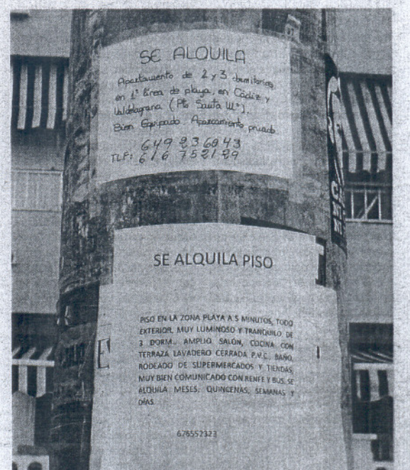
Ofertas de pisos pegadas en el Paseo Marítimo.