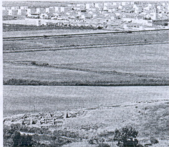
Doña Blanca es el emplazamiento sobre el que se trabaja para la acería.

Las conversaciones con la acería se han mantenido durante meses, pero éstas se han visto entorpecidas por el renovado marco energético hasta el punto de que desde Celsa aseguran que no hay un foro de negociación desde el verano. Fuentes de la Junta aseveraron, sin embargo, que los encuentros se han seguido produ-