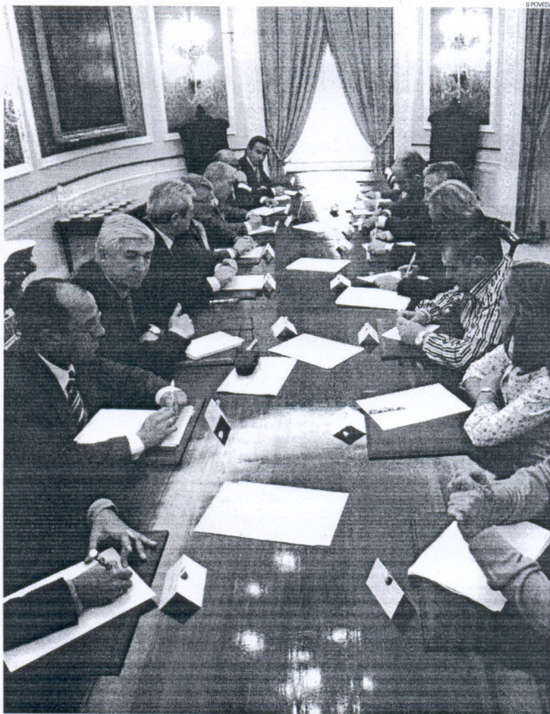
El Consejero de Innovación de la Junta de Andalucía presidió el Consejo Económico y Social Provincial.

Era inevitable la referencia al sector de la construcción y a la vi-