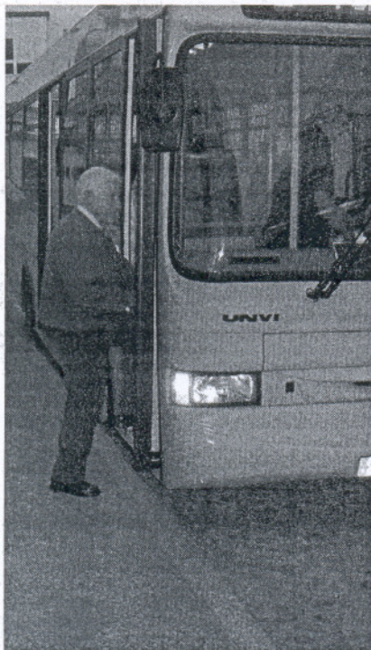
El número de plazas también ha crecido en los últimos años.