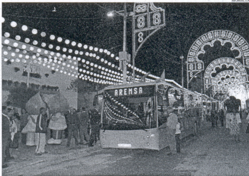
La noche del pasado miércoles se usaban por primera vez los dos nuevos autobuses de la flota municipal.

El consejero delegado recordó algunas de estas mejoras que Aremsa está llevando a cabo con los autobuses desde que se tomara el testigo en 2004 de este servicio, ya que anteriormente dependían de la cooperativa de autobuses Villa de Rota. Así, tal y