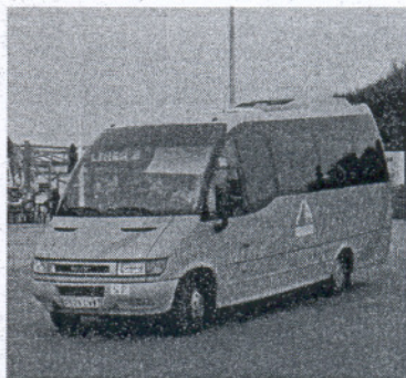
Los microbuses destacan por su gran funcionalidad.