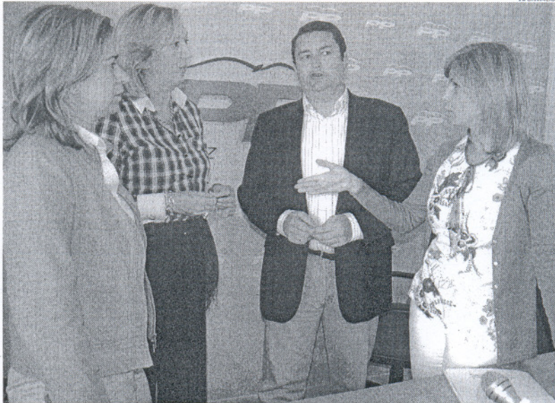
Sanz aseguró ayer que la Ley contra la Violencia de Género es "un rotundo fracaso".

Sanz indicó que esta medida ya está en funcionamiento "en otras comunidades autónomas, incluso en algunas que no están gobernadas por el PSOE", y denun-