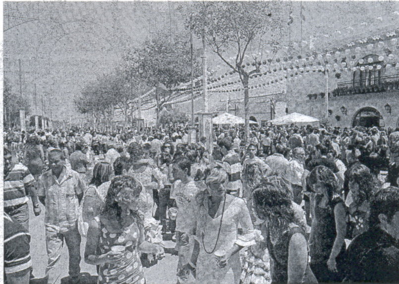
La Feria presentará mucha animación durante todo el fin de semana.

Para hoy sábado se espera una masiva afluencia de público no solo de Rota sino de localidades vecinas que, sin duda, lograrán un lleno absoluto en el Real durante todo el día ya que desde hace algu-