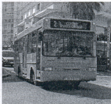
Desde 2004 se han ido aumentando las líneas.