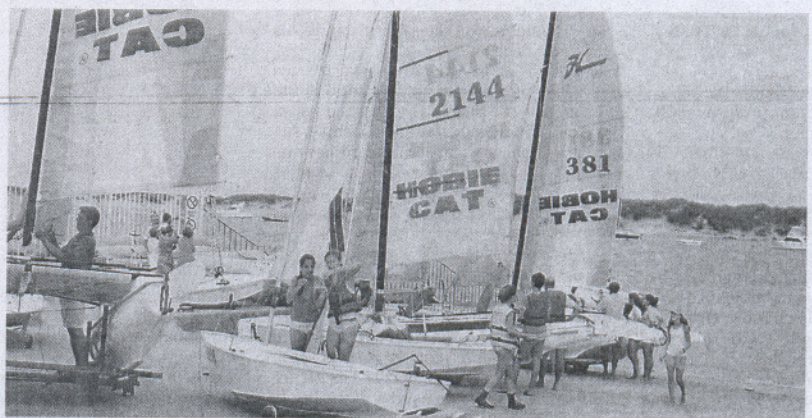
ESCUELA. Jóvenes alumnos practican vela de la mano de una firma de Sancti Petri.

«Abrir más de seis meses en Sancti Petri es una utopía para las firmas náuticas»