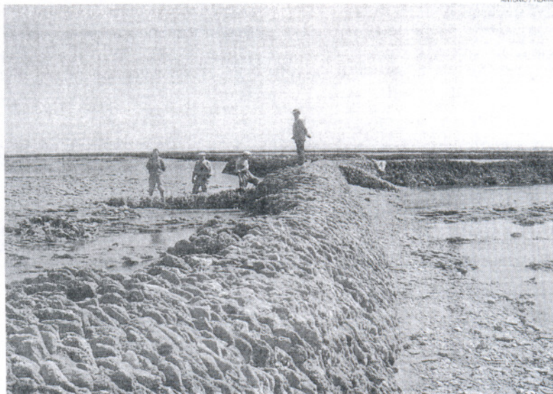
Los corrales de pesca, declarados monumento ecocultural y que han sido fruto de tanta discrepancia.

Para Ecologistas en Acción, en primer lugar el texto en cuestión es inadecuado desde su misma redacción, que según afirman contiene numerosas incongruencias, y seguidamente no es aceptable desde el punto de vista jurídico, "porque plantea articulados que rayan la inconstitucionalidad". Además, según este grupo, este texto deja a Ecologistas fuera de juego en la participación para la defensa del monumento ecocultural, cuando "desde el principio hemos estado involucrados en la