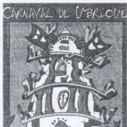
Cartel del Carnaval 2008.

En todas ellas participarán las cuatro agrupaciones locales que este año saldrán a la calle, las chirigotas 'Ya estamos aquí', 'Los del barrio', 'Los estradivarius (Venida