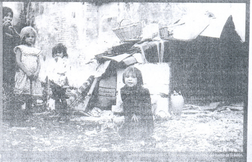
Cádiz, septiembre 1975. Niños en las calles del barrio de El Balón.

Horarios: De lunes a viernes Mañana de 10.00h a 14.00h Tarde de 16.30h a 21.00h Sábados de 10.00h a 14.00h 12.00h a 13.30h