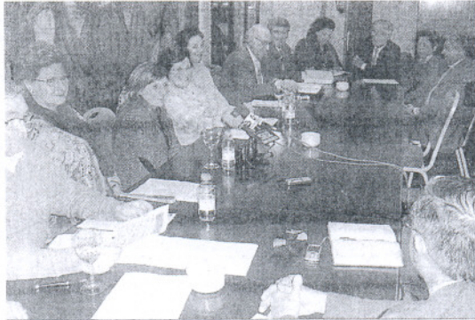
Un momento de la asamblea de la Fundación ARAS celebrada ayer.

Según comentaron, la ejecución de esta última iniciativa se ha visto ralentizada en los últimos meses por el compromiso público de rehabilitación del antiguo asi-