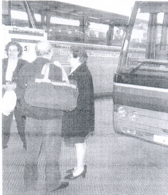
Viajeros afectados por una jornada de huelga, en una imagen de archivo.

La mayor parte de la plantilla secundó ayer dos interrupciones del servicio entre las 6.30 y las 9.30 horas y las 18 y las 21 horas. No hubo ningún incidente que reseñar, salvo la concentración pacífica de un grupo de trabajadores ante las cocheras, por la mañana, y de otro, ante la estación, por la tarde-noche. Este último, en algún momento cruzó una pancarta reivindicativa en la carretera.