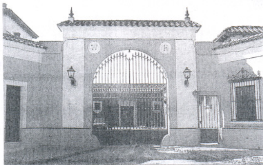
Instalaciones de Bodegas Valdivia en Jerez de la Frontera.

En esta nueva apuesta por el sector bodeguero, justo cuando la actualidad está marcada por el incremento en el precio del alcohol y la problemática surgida con los