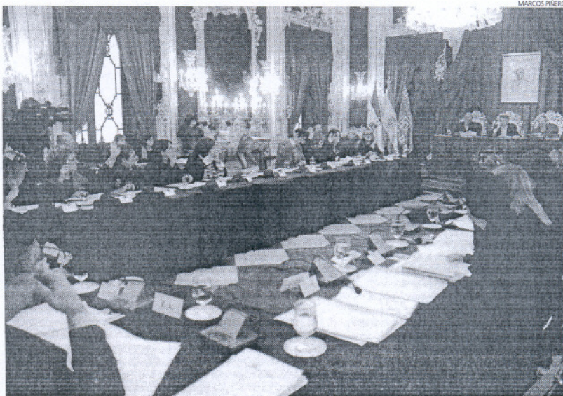
El Pleno de la Diputación Provincial fue el escenario del último enfrentamiento PSOE-PP.

El secretario provincial de los socialistas se pregunta si los alcaldes y representantes municipales del PP en la provincia están dis-