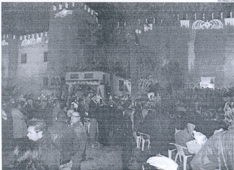
Se prohíbe el acceso a estas fiestas a menores de 16 años, y los menores de 18 no podrán comprar alcohol.

Entre estas normas se define que la solicitud deberá presentarse con un mínimo de quince días hábiles de antelación a la celebración en el Registro General del Ayuntamiento, expresando el nombre o razón social, NIF y datos personales, o en su caso del representante legal y lugar de celebración, de manera que las soli-