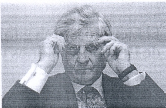
El presidente del BCE, Jean-Claude Trichet, ayer.

Gráfico: Dpto. de Infografía.