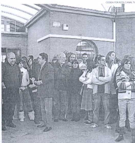
El director del centro dio lectura al comunicado ante alumnos y profesores.

En su comunicado, el claustro de profesores ha querido destacar por encima de todas las cosas que en ningún modo su intención es "estigmatizar" al alumno en cuestión, pero reconocen que "muestra un comportamiento cada vez más irritable y psicológicamente inestable que hace imposible que dentro de un grupo numeroso