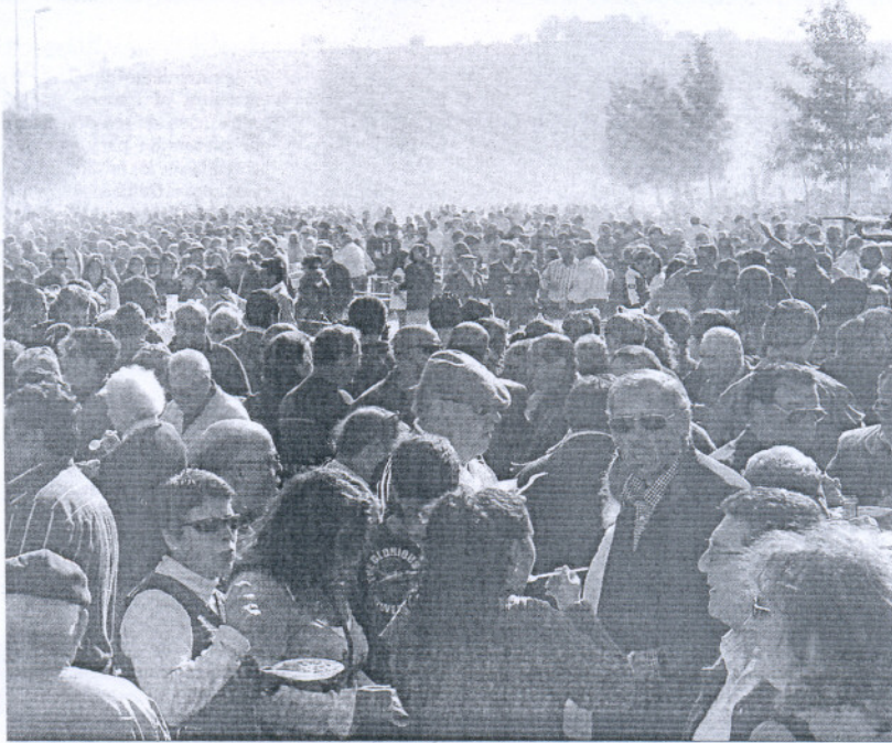
Este domingo se desarrollará en Trebujena el siempre multitudinario concurso de cocina y mosto.

En Rota, a las ocho de esta tarde se inaugura el IV Mercadillo de Navidad, que estará abierto hasta el lunes en la plaza Bartolomé Pérez