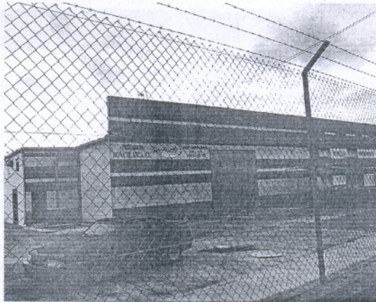
La nave que usaban los procesados, ubicada en El Puerto.

La resolución de la Sección Cuarta, de la que ha sido ponente la magistrada Ana María Rubio Encinas, relata que los procesados usaban la nave, denominada Pescados Doña Blanca, como pantalla para enmascarar el tráfico de las diversas drogas y sustancias estupefacientes que almacenaban allí. En la nave, agrega, no se desarrollaba actividad lícita alguna y estaba dotada de notables medidas de seguridad: cámaras