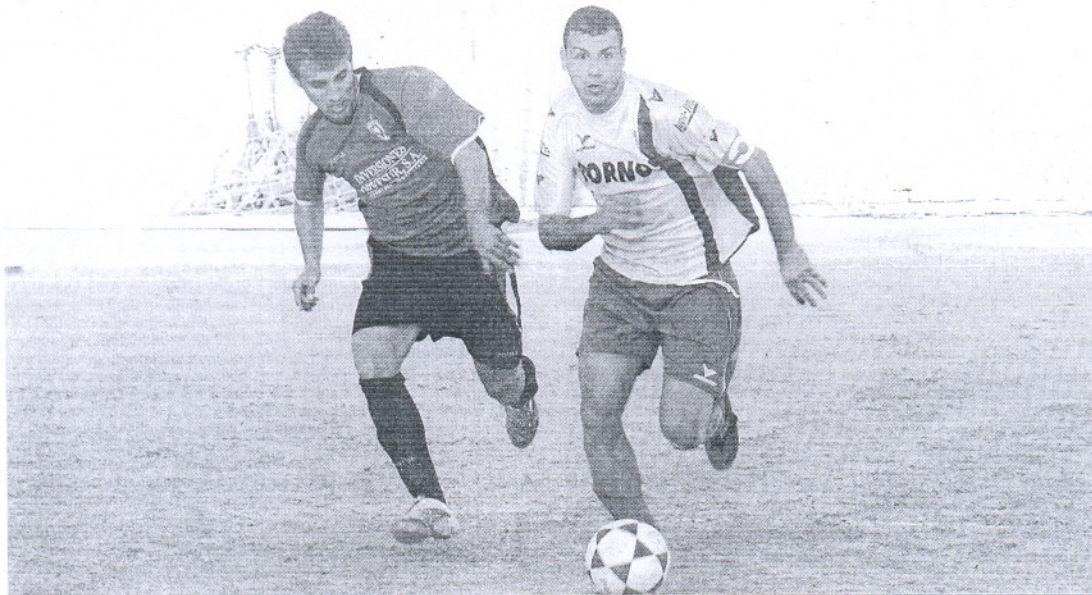
Un futbolista del Bornense conduce el balón ante un jugador del Chiclana Industrial.