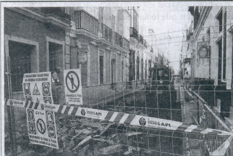
La primera fase de las obras se ejecutará entre las calles Castelar y Cruces.

García anunció el miércoles pasado esta ronda de encuentros aludiendo a su objetivo de “presentarles las iniciativas que va a emprender el equipo de Gobierno en el nuevo curso político”, difundidas públicamente por la propia alcaldesa en una rueda de prensa ese mismo día. Añadió entonces que serían entrevistas abiertas a las “aportaciones” de las formaciones políticas del Consistorio a fin de “abordar de manera consensuada” los diferentes asuntos de la gestión municipal, especialmente la “delicada” situación de las cuentas del Ayuntamiento y las consecuencias de la actual crisis económica en la ciudad. Esta cuestión figura como prioritaria en los planteamientos de la regidora sanluqueña, junto a la resolución de “las deficiencias de las barriadas” y la construcción de viviendas de promoción pública mediante un plan municipal previsto al efecto.