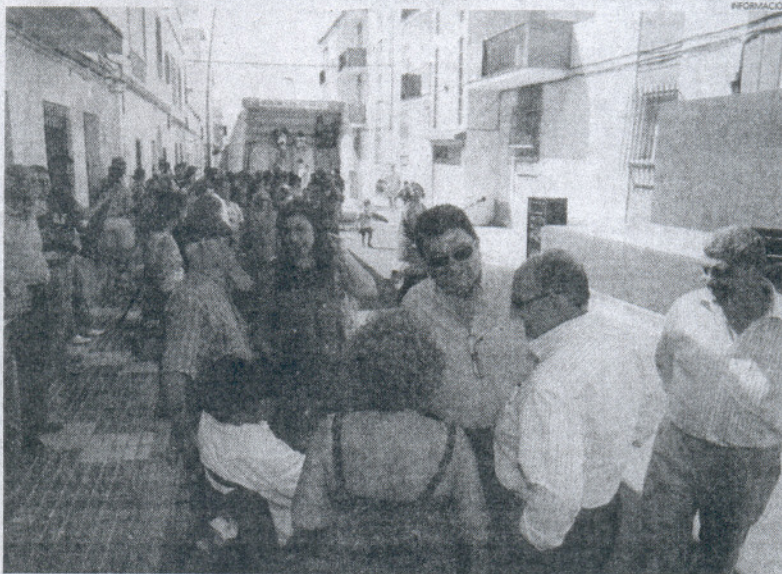
Corporación municipal y vecinos compartieron una jornada de celebración del final de las obras acometidas.