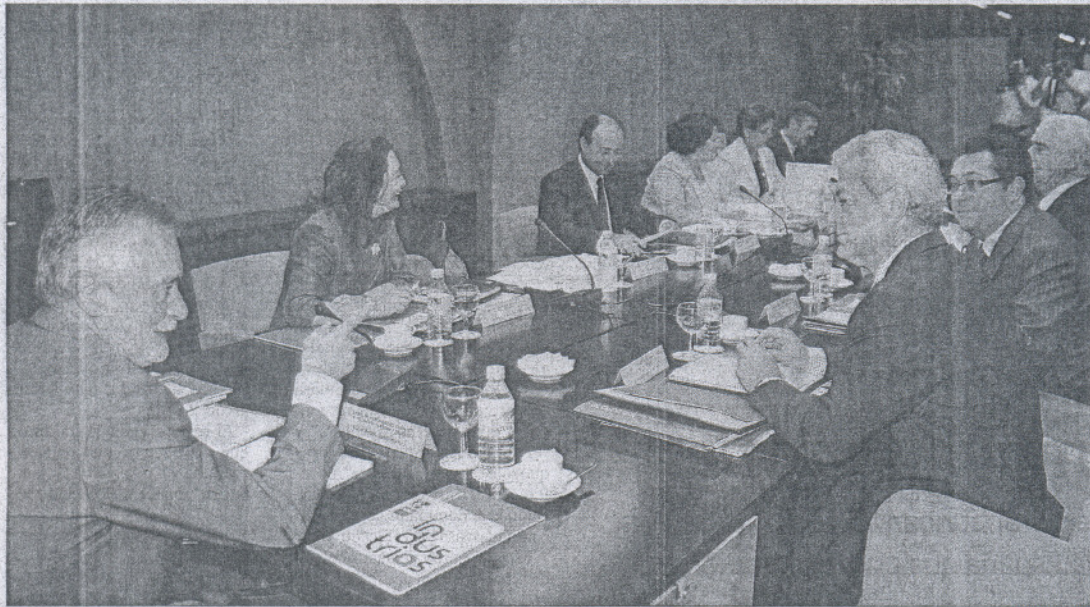
El vicepresidente José Antonio Griñán, ayer durante la reunión que mantuvo con nueve consejeros en Sevilla.

Chaves plantea la reconversión de estas edificaciones en VPO • El consejero de Vivienda destaca como uno de los objetivos en la primera fase de la legislatura rescatar "el parque de vivienda muerta"