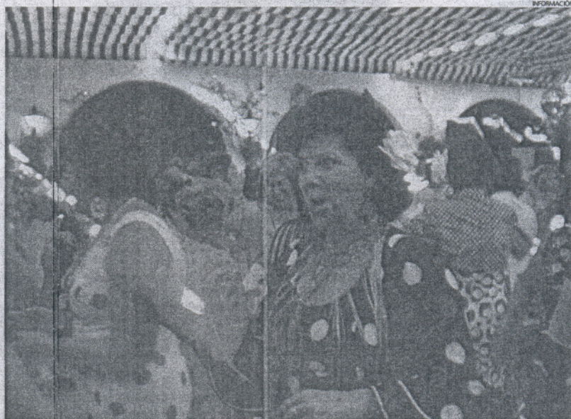
Afortunadamente, este año los grandes protagonistas de la Feria han sido los bailes, los cantes y el buen tiempo.

Seguidamente, se mostró muy contento de que "este año, pese a la crisis que se vive en estos momentos, y coincidiendo con la Feria de Jerez, la asistencia a la Feria