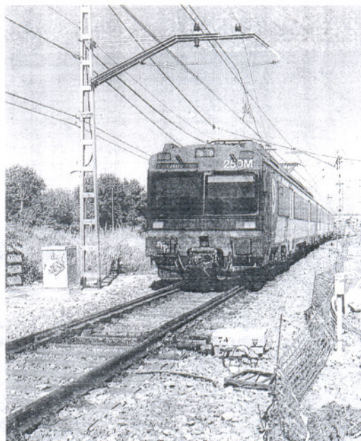
La línea Sevilla-Cádiz sufrió ayer otro incidente.

Unión de Consumidores explicó que "según nos informan los usuarios, el motivo del retraso ha sido el robo de cables en el corredor de la citada línea, cuestión que ya ocurrió hace un par de semanas. Además, en comentarios de los usuarios, en ninguna de estas circunstancias se han tomado medidas alternativas como auto-