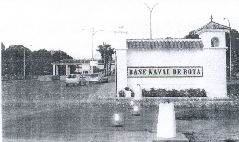
BASE. El primer tramo irá desde el control del recinto militar hasta el primer acceso a la localidad.

afectaría a la conocida como curva de La Pedrera con el objetivo fundamental de suprimir la misma por una rotonda evitando el peligro que supone en la actualidad. En este caso, ya se ha obtenido la aprobación del Ministerio de Defensa para poder expropiar un trozo de suelo perteneciente a la Base Naval y retranquear así tanto la valla como la carretera de servicio del recinto militar.