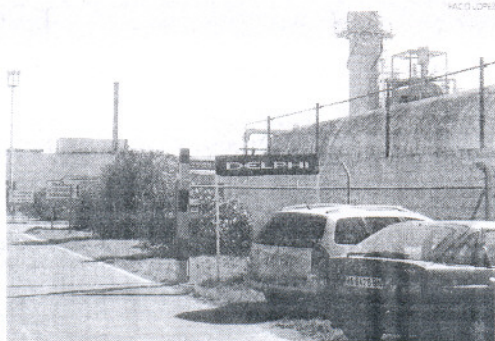
La crisis de Delphi impulsó las ayudas a la reindustrialización.

tinan en 2008 para ayudas a actuaciones de reindustrialización en la Bahía se destinan 20 millones a subvenciones u 80 millones a créditos reembolsables.