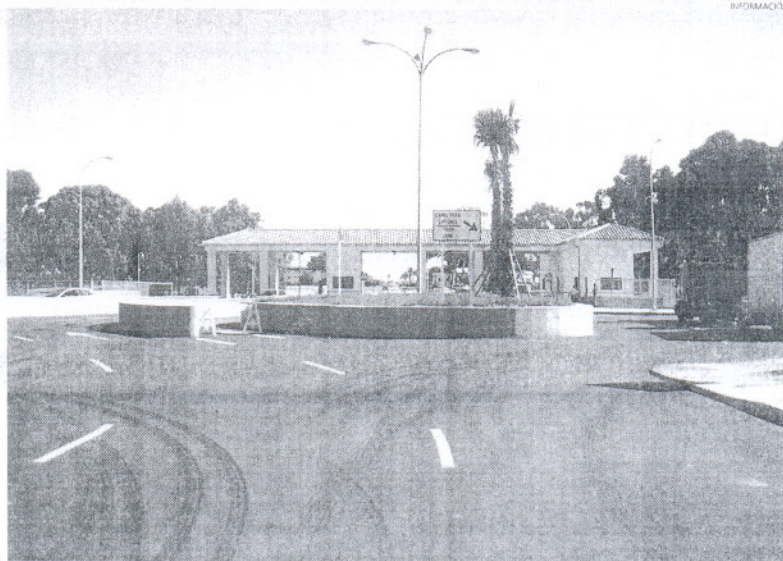
La rotonda de entrada de la Base Naval, una de las actuaciones del ayuntamiento que recogerá este convenio.