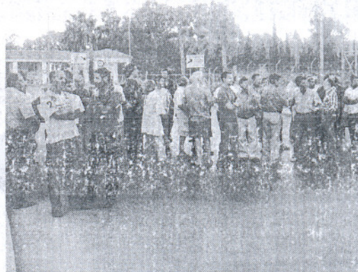
Los trabajadores siguen demandando que se respeten sus derechos.

de los PLLs (por reducción) a todos los efectos, excepto para el pago de la indemnización. También ha ofrecido el uso de las horas de enfermedad tal y como recoge la Ley de Conciliación Laboral, la compensación de la falta de estudios por experiencia para empleados del 1 de enero de 1995 y la reducción en la edad del retiro de los bomberos. Según el Comité "no ofrecen nada que ya no esté acordado", y no hay una oferta de convenio "ni digna ni seria. Además, el Comité ha realizado un llamamiento a los políticos nacionales en periodo electoral para solucionar el asunto.