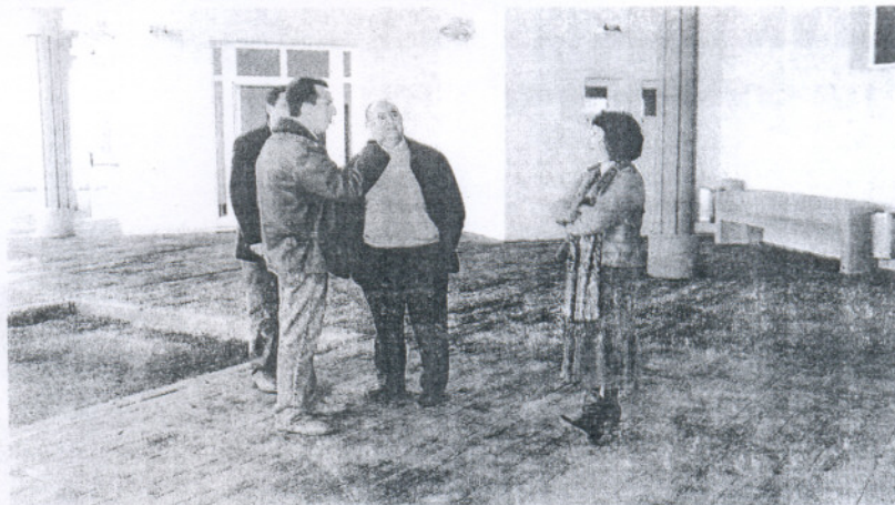
VISITA. Los delegados municipales revisaron la puesta a punto de las instalaciones.

Por otro lado, integrado en este Centro Intermodal de Transporte también se ha construido una sala multiusos de grandes dimensiones, de manera que además de ofrecer todos los servicios propios de una estación, el nuevo edificio cuenta con un espacio común que servirá de