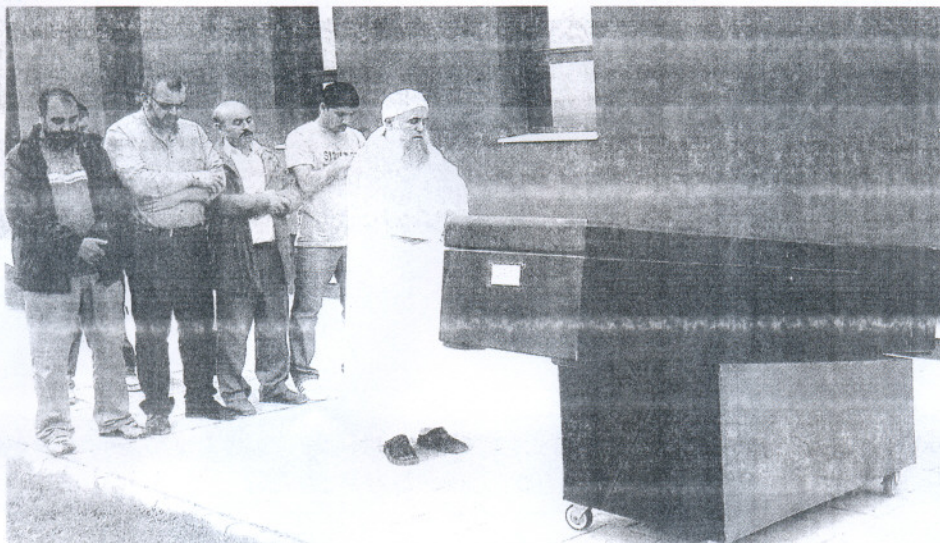
TRAGEDIA. Entierro de los cadáveres sin identificar, fallecidos en el naufragio de la Patera de Rota.