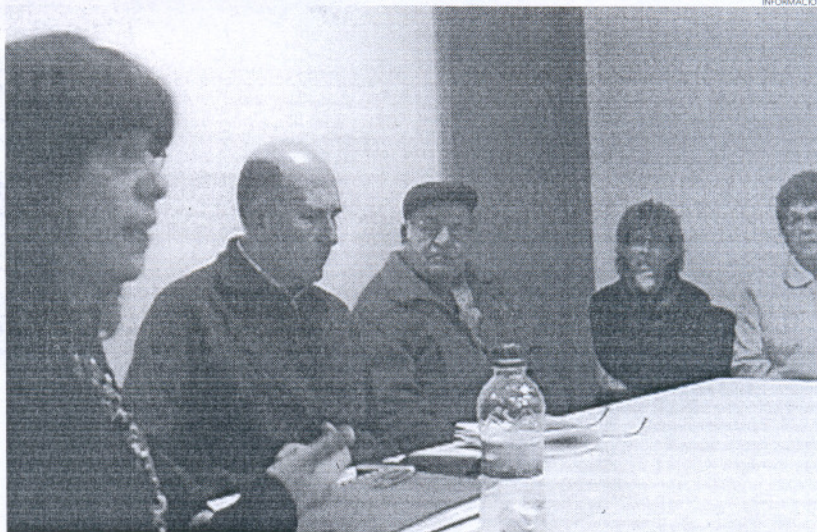
La delegada de Participación Ciudadana explicó a los vecinos el resultado de la intervención del Consistorio.

En este encuentro, un grupo de vecinos de las calles Calderón de la Barca, Buenavista, Lope de Vega y otras colindantes expusieron a la representante municipal la situación que atraviesan con el fin de buscar el apoyo y asesoramiento del Ayuntamiento frente a sus reclamaciones con la compañía suministradora del servicio eléctrico, ya que los afectados ya habían comunicado este problema tanto telefónica como personalmente a la empresa, sin que