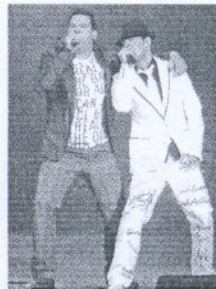
Actuación de Andy & Lucas.

Andy & Lucas llenaron el Teatro Falla en sus dos actuaciones