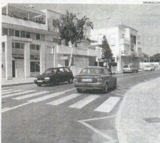
El refuerzo de la señalización de la calzada mejorará la visión.

Esta última acometida se enmarca dentro del paquete de actuaciones que el Consistorio está llevando a cabo para la temporada que ahora se inicia.