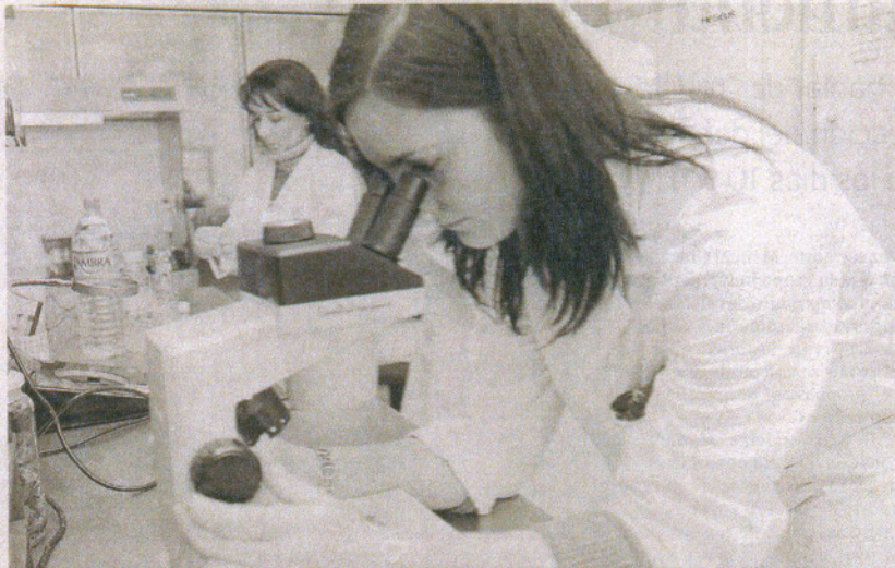
Una joven investigadora en imagen de archivo. Ciencia es una de las cinco categorías del premio.