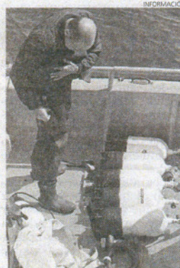
Rescate del pesquero.

Finalmente, espera que la justicia pueda esclarecer los hechos y las responsabilidades que pudieran derivarse "incluso para la ministra de Fomento", Magdalena Álvarez, que fue "la última respon-