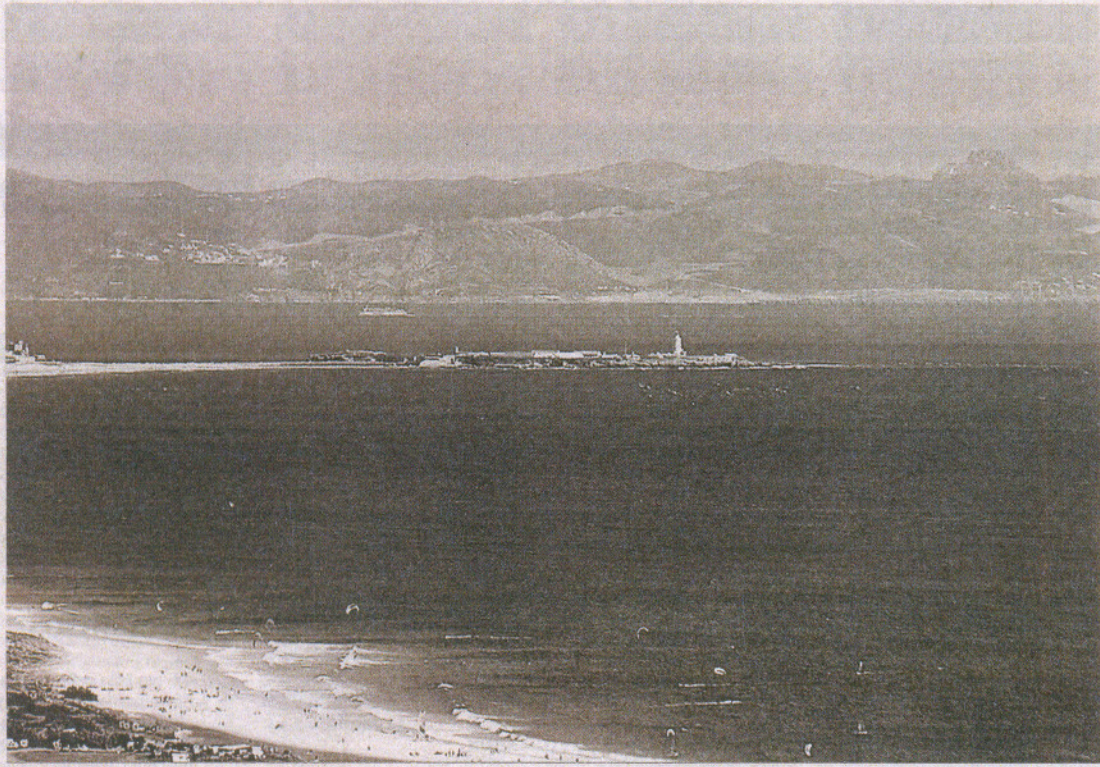
La playa de Valdevaqueros, en Tarifa, será uno de los destinos que aparecerán en el vídeo promocional de Cádiz del touroperador alemán TUI.