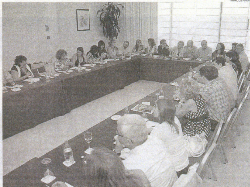
Reunión de la Ejecutiva Provincial socialista durante la tarde de ayer en un hotel de la capital gaditana.

En este sentido, el dirigente socialista pidió "confianza" en la ac-