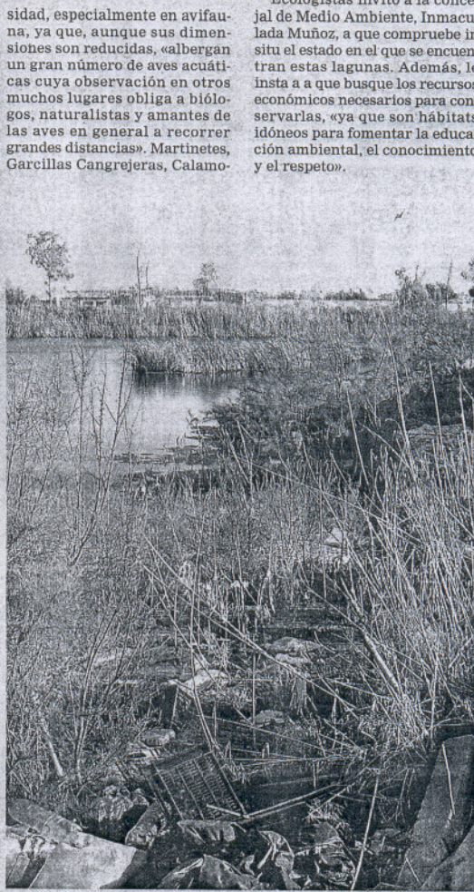
BASURA. Estado en el que se encuentran los humedales.