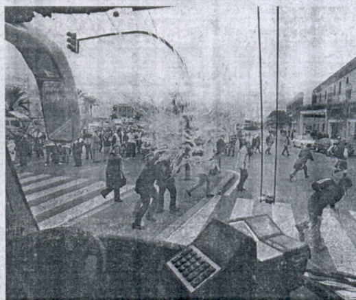
El impacto de un huevo ante el parabrisas de un autobús.

El fracaso del diálogo con la empresa con el fin de desbloquear las