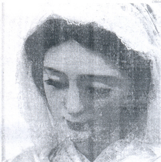
Rostro de Nuestra Señora del Socorro.

Dicha empresa nació en diciembre de 2003 promovida por la Fundación, contando con los talleres de Orfebrería, Bordado, Dorado, Tallo y Carpintería, todos ellos enfocados principalmente a las hermandades y cofradías, así como a los artículos religiosos en general, y con el objetivo de atender la demanda creciente en la provincia y en el resto de España. Oloz Arte ha venido realizando los