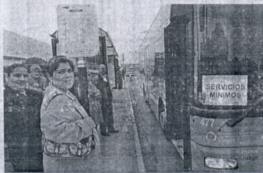
Usuarios del Clínico hacen cola ante el autobús urbano de Puerto Real.

res de los autobuses explicaron que los vecinos de cada localidad, alertados ante la huelga, habían optado por no desplazarse al hospital o bien hacerlo en sus vehículos particulares. De hecho, los aparcamientos del Clínico se veían ayer especialmente saturados. También los taxistas notaron un leve incremento de carreras en el entorno de la Bahía, pero especialmente a Puerto Real y a la capital gaditana. /R.U.F.O.