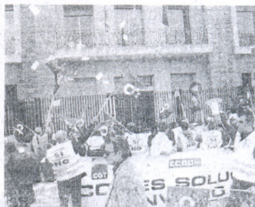
La marcha paró frente a Subdelegación.