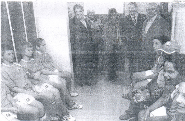
Los niños y los representantes municipales conocieron las nuevas instalaciones.

son un punto y seguido a las actuaciones que el actual equipo de gobierno viene realizando en los campos de Forestal, donde tal y como recordó Manuel Laynez, se ha logrado que las pistas de tierra pasasen a ser pistas de césped artificial y que contasen con iluminación, al mismo tiempo que se ha adecuando toda la zona de entrada a este recinto deportivo que se encontraba especialmente deteriorada.