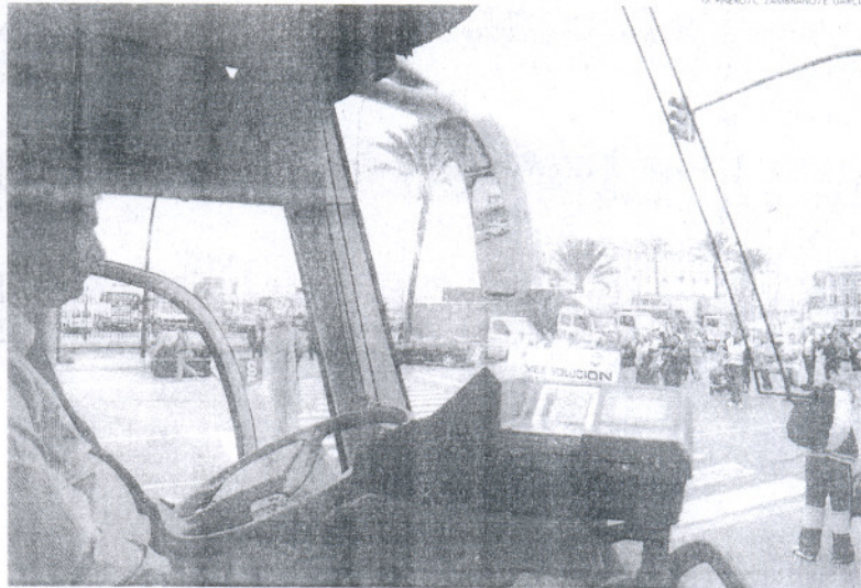
Los trabajadores lanzaron huevos contra un autobús que coincidió con la manifestación.