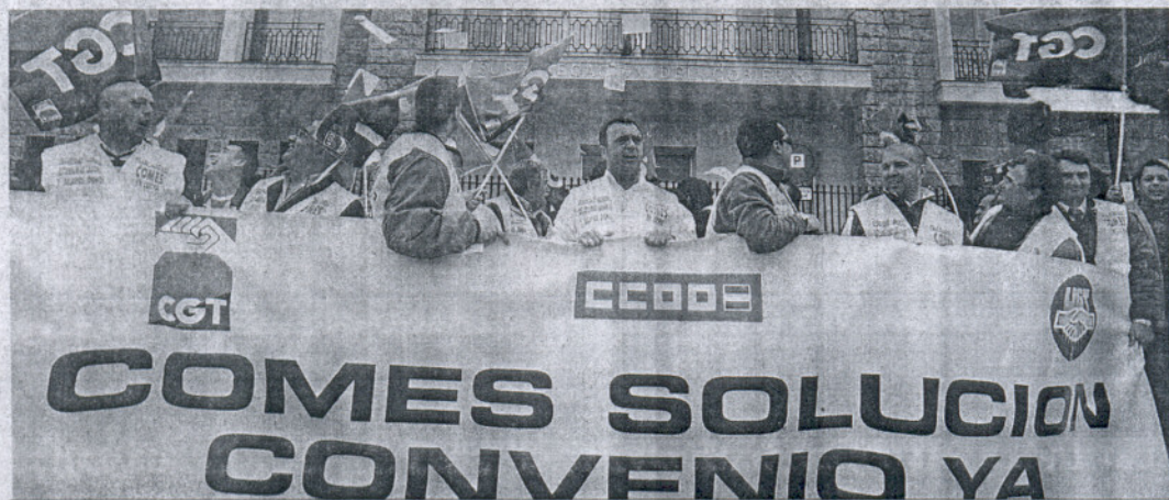
La cabecera de la manifestación durante una parada de protesta ante la Subdelegación del Gobierno.

Unas 400 personas se manifestaron en Cádiz y acusaron a la empresa de "negociar con la seguridad de conductores y usuarios" • El comité instó a la Junta a retirar la concesión del servicio a la compañía