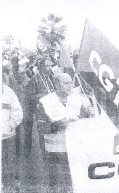
Los empleados recorrieron las calles de Cádiz.

muchos meses de tensión y es fácil perder los nervios", añadió.