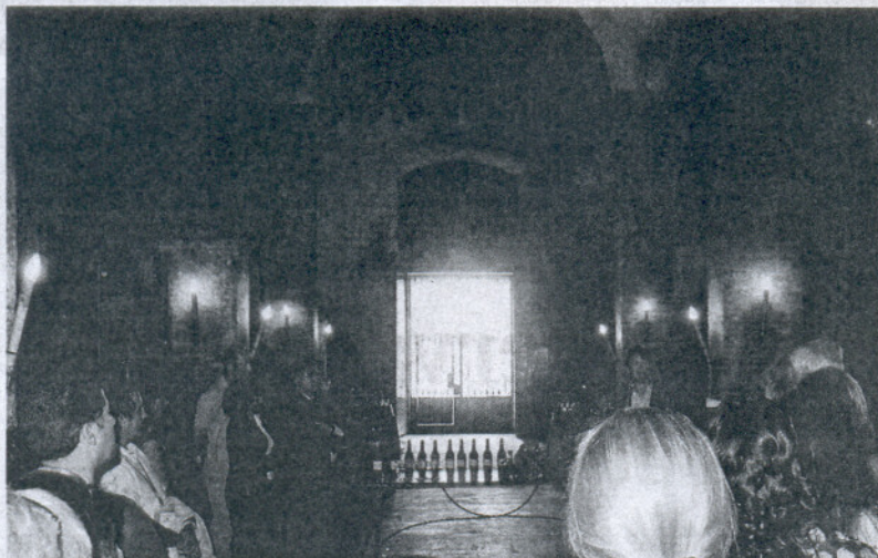
Una reciente visita turística a una bodega de la localidad.