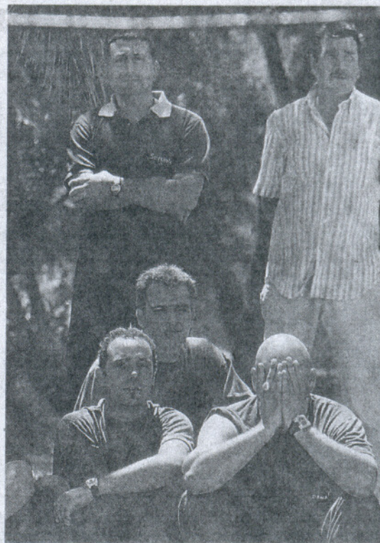
AFFECTADOS. Grupo de afectados por el cierre de Delphi perteneciente a Capital Energy Biofuel.

Son nueve -de las que siete pertenecen al sector de las energías renovables, una de las apuestas industriales de la Administración