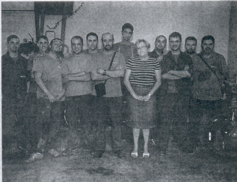
Los alumnos del curso han aprendido desde aspectos de la mecánica de motos hasta el uso de maquinaria.

La delegada se mostró satisfecha por el desarrollo de este curso, tanto por lo que corresponde al Ayuntamiento, es decir, por seleccionar a un buen profesional como monitor, y por facilitar los medios materiales que requería el curso, como por la "enorme motivación" que han puesto los alumnos.