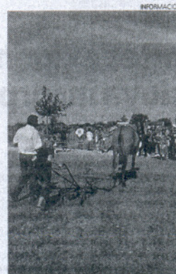
Los aperos clásicos de labranza.

Entre otras atracciones, el Centro de la Mayetería ofrece a veci-