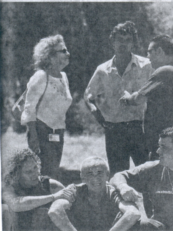
cientos a una de las subcontratas de la factoría.

El PSOE obliga a sus alcaldes de la provincia a tomar medidas de reducción de gastos ante la crisis