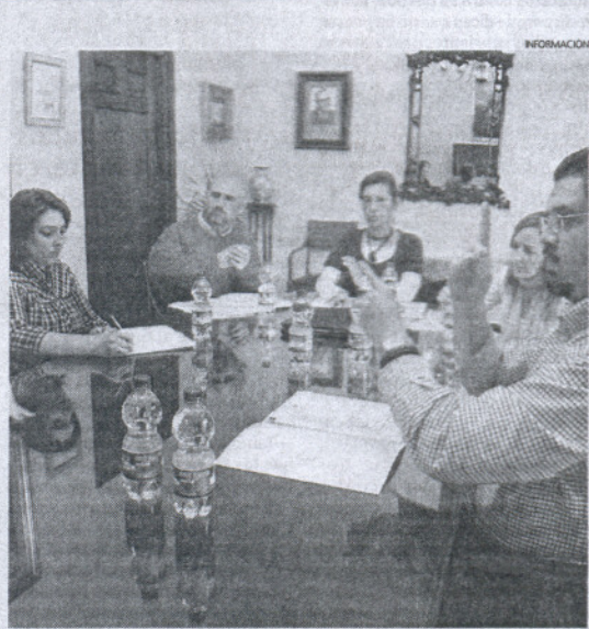
La inserción en la vida local de Asorca cubre un vacío para el colectivo.

vés de sus delegados de Participación Ciudadana y de Servicios Sociales, y teniendo en cuenta las demandas de los roteños afectados, mostró su interés en acercar esta asociación a la localidad, destacando la importante labor que realiza Asorca en toda la provincia a la hora de atender a las familias con discapacidad auditiva, impulsar el servicio de intérpretes de lengua de signos, o promover la lengua de signos, que tal y como explicó la representante municipal ha sido reconocida tras la aprobación del proyecto de la Ley de Lengua de Signos, en el que también se regulan los medios de apoyo a la comunicación oral de las personas sordas.