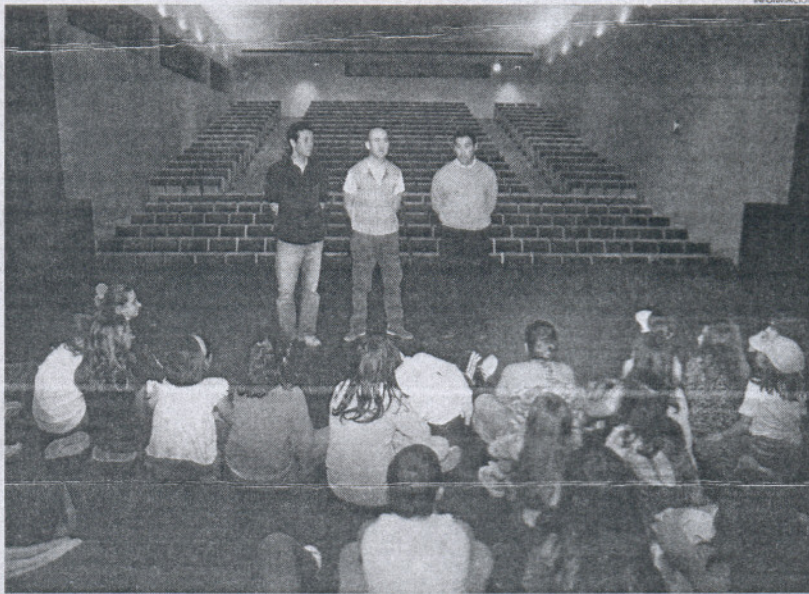
Crear cultura teatral entre los más pequeños es uno de los objetivos principales de los talleres municipales.

A este taller de infantil se suma el taller de teatro de Secundaria y un taller en el que se engloban los alumnos de segundo ciclo de ESO y Bachiller. Así, los 160 ó 170 niños y jóvenes que participan en estos talleres, ensayan ya en las salas del teatro, que también acoge