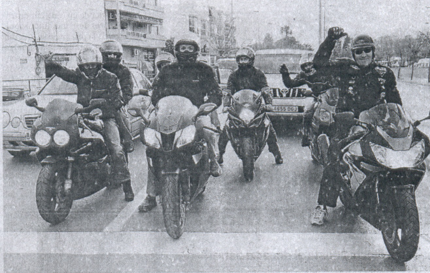
TENDENCIA. Empresarios y Consistorio coinciden en que el perfil del visitante está cambiando.

La edil se congratuló de dicha iniciativa, que supondrá una participación mucho más efectiva de los afectados en la consecución de la Motorada. Además, aprovechó para anunciar que «hemos elevado el perfil del visitante», refiriéndose al hecho de que el afi-