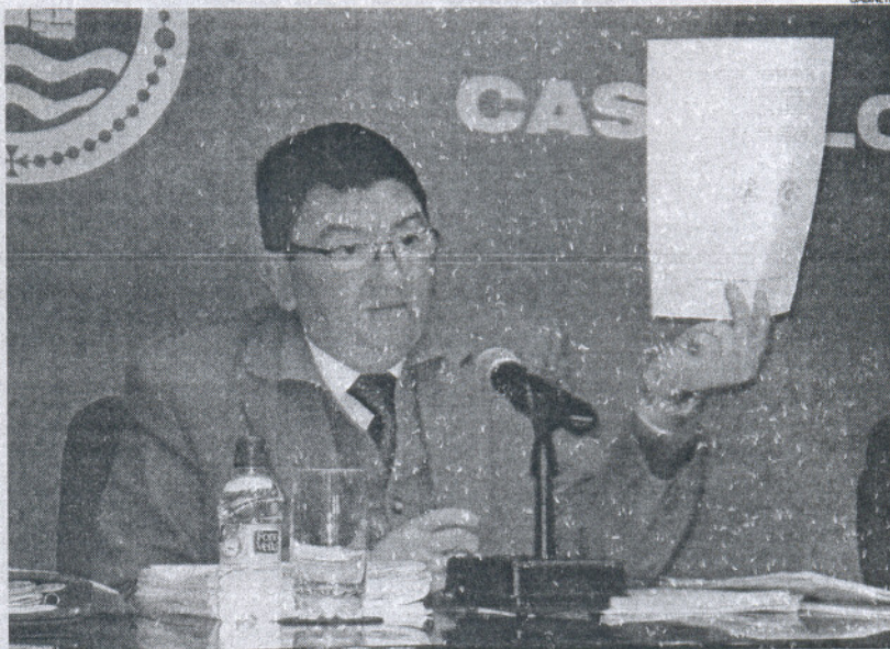
El alcalde mostró su satisfacción por la puesta en marcha, por fin, de este proyecto que "tanto ha costado".

Así, tal y como explicó el primer edil, la cesión de un terreno de 3.750 metros para hacer un complejo residencial levantó en un principio mucha polémica, ya que el destino no respondía a lo que la mayoría del Pleno municipal