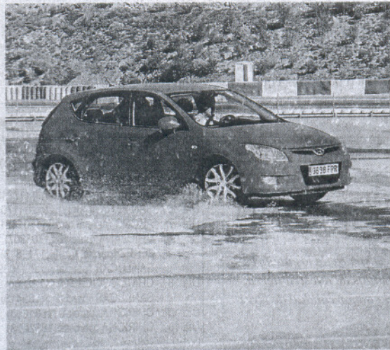
PRUEBAS. Los coches sortearon multitud de obstáculos.