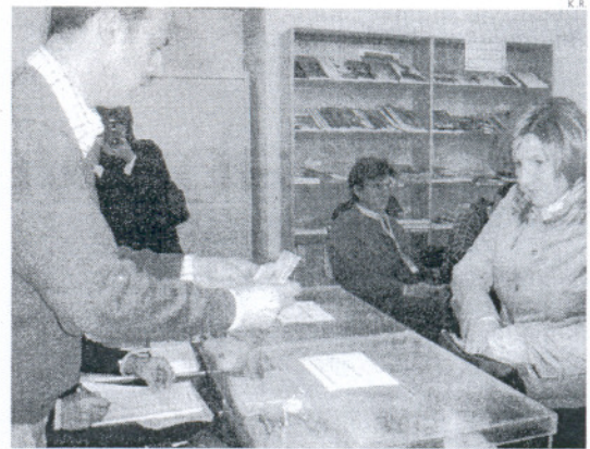
La alcaldesa de Sanlúcar, Irene García, ejerciendo su derecho al voto.

las 1.594 mesas habilitadas en un total de 587 colegios. De todas formas no faltaron las anécdotas características de estas jornadas, si bien no tuvieron mayores incidencias. Así, por ejemplo, en la localidad de Puerto Real se ausentó uno de los funcionarios que debía transmitir los datos a través del sistema PDA, facilitado esta año por primera vez por la Junta de Andalucía, para agilizar el recuento de votos, así