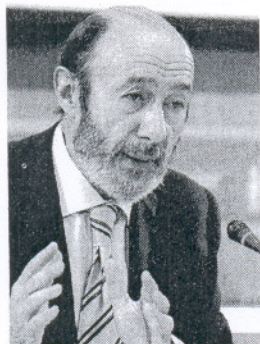
Alfredo Pérez Rubalcaba (PSOE).