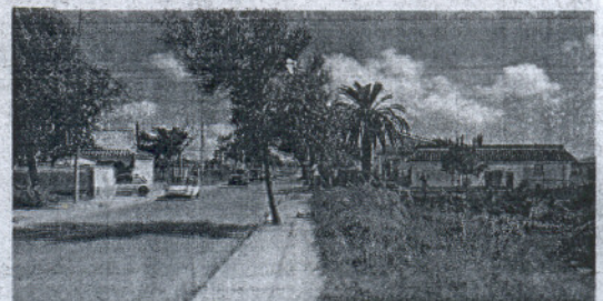
En una de las carreteras de la zona fue atropellado un niño.

También se ha conseguido que el autobús escolar tenga tres nuevas paradas en Los Llanos, contribuyendo así a luchar contra el absentismo escolar. Asimismo se ha atendido la demanda urgente de escolarización de un niño de 11 años de la zona con una severa discapacidad que se encontraba sin escolarizar debido a la misma y que ha sido ubicado en el centro local de Afanas. Igualmente, la delegación trabaja para fomentar la Democracia Participativa y el trato directo de la institución municipal con los colectivos sociales. En este sentido, Louza afirmó que «es de destacar la labor de trabajo y trato directo emprendida por esta delegación con los diversos colectivos del área de su competencia a lo largo de 2007».