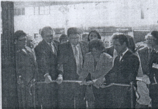
El teatro abrió sus puertas al público el pasado 28 de febrero.