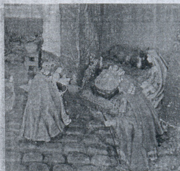
Premio especial para el estanco Lobato.

del medio audiovisual, para tomar cuantas fotografías como imágenes grabadas de vídeo se consideren necesarias, a fin de contar con un archivo de los mismos, para la realización de futuras publicaciones, exposiciones, etc.