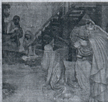
Segundo premio de escaparates para el Barato.