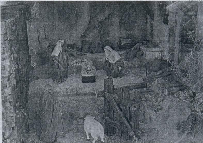
Imagen del Misterio instalado por el primer premio de escaparates, de Cuadros Izquierdo.

Al mismo tiempo, las bases advertían que el jurado podría ir acompañado de un profesional