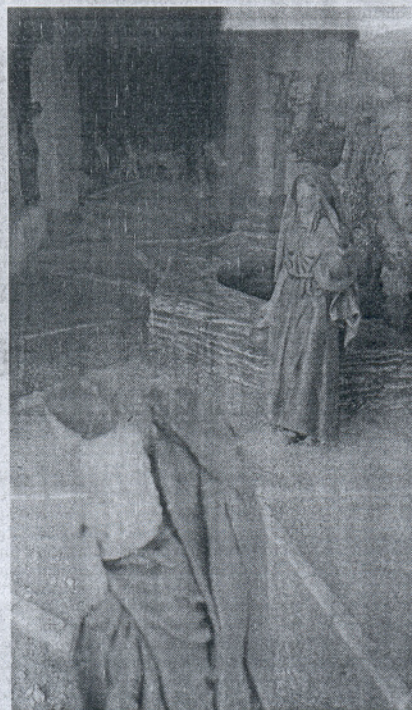
Detalle en perspectiva del belén de Cuadros Izquierdo.