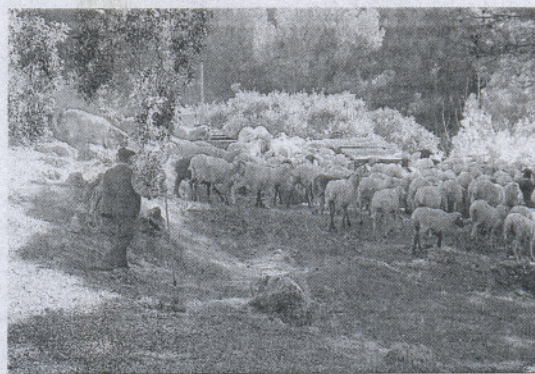
Un pastor, en una de las fincas donde se realizan las labores de pastoreo.