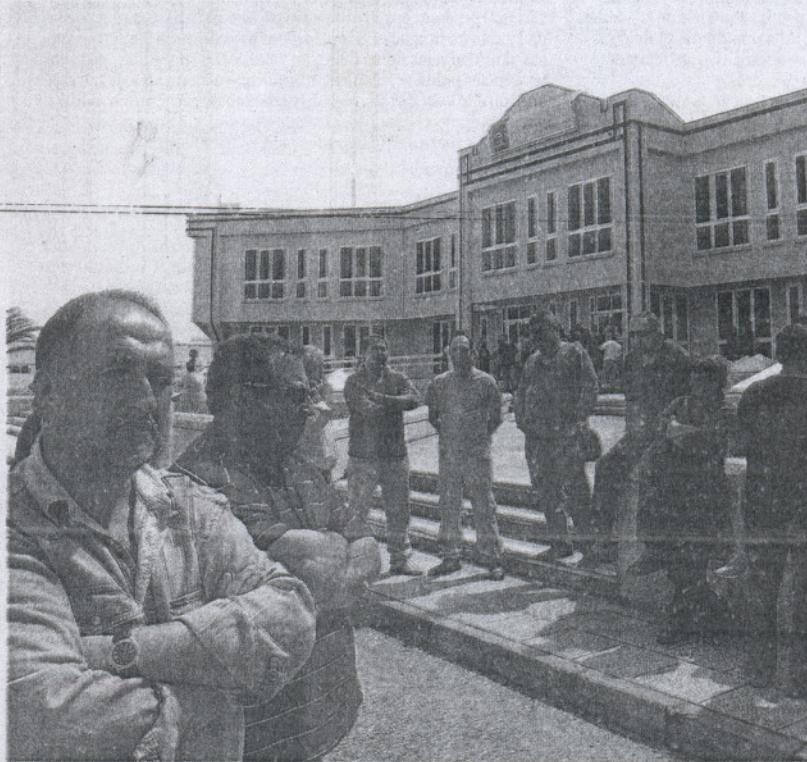
Ex empleados de Delphi, frente a las instalaciones de uno de los centros de formación en Puerto Real.