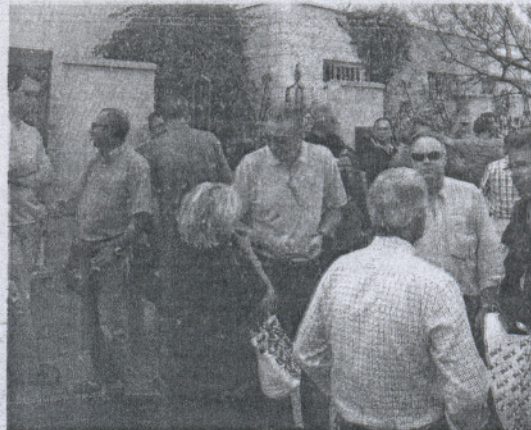
Paro de los cursillistas en el centro de formación de San Fernando.