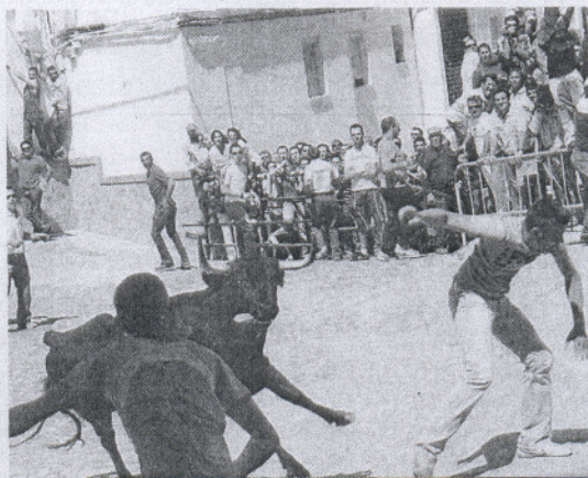
Una de las sueltas de vacas de este fin de semana en Alcalá. MANUEL ARAGÓN PINA

Los actos del domingo, último día de fiestas, se iniciaron poco minutos después de la una de la tarde con el chupinazo anunciado la suelta de la primera vaca de nombre 'Corales' hermoso ejemplar de color negro bragado marcada con el número 717 en las costillas que causó una buenísima impresión, noble y encastada que permitió el lucimiento de los corredores. También fue muy bueno el comportamiento de 'Enfurrufñadita', hermana de la anterior de la ganadería de Carlos Nuñez, marcada en el