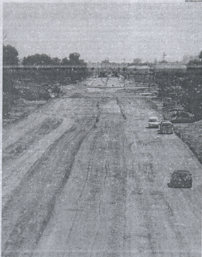
El V5 es la prolongación de la avenida de los Morancos, y paralela a Príncipes de España.

Los nuevos viarios articulan la circulación y el desarrollo de un sector cuya joya de la corona será el proyectado Hotel Escuela.