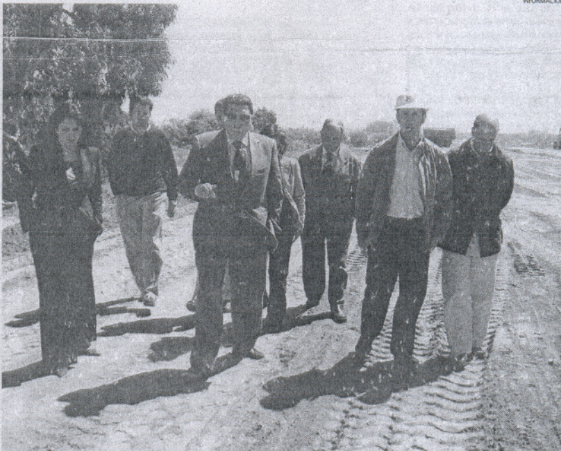
El alcalde ha destacado el significado de la articulación de los nuevos viarios para la zona norte de Rota.

En ambos casos las nuevas avenidas constan de carril bici, un acerado de unos 3 metros, una zona de aparcamiento de 2,2 metros, o una calzada de doble vía de seis metros de anchura en cada sentido. Sobre el terreno, y teniendo en cuenta el nivel de desarrollo de cada tramo, el alcalde de Rota explicó que el V5 que conecta con la piscina y por tanto con el recinto ferial podría estar concluido para la Feria de Pri-