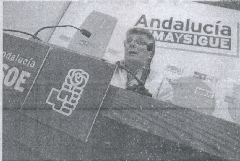
Cabaña presentará su candidatura a la reelección después del "buen trabajo político conseguido por el partido".

Ante este proceso, el dirigente socialista confirmó que presentará su candidatura a la reelección como secretario general del partido en la provincia gaditana, des-