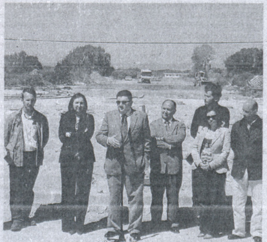
El alcalde y su equipo visitan las obras.

De esta forma, y una vez recuperados los terrenos del camping, se pone en marcha el desarrollo de la urbanización de la zona, en la que también se ha realizado una importante obra a la hora de canalizar el arroyo Alcántara que canalizará las aguas pluviales. La inversión total ronda los seis millones de euros financiados por las juntas de compensación de los sectores afectados.