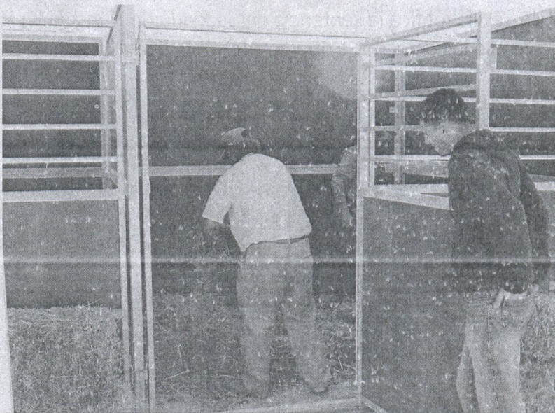
Dos operarios preparan los boxes que acogerá al ganado.

Ya por la tarde, sobre las seis saldrá la cabalgata de Feria desde la plaza de la Constitución, recorriendo las avenidas de San Miguel, Buenavista, Andalucía y Los Remedios siguiendo hasta la pla-