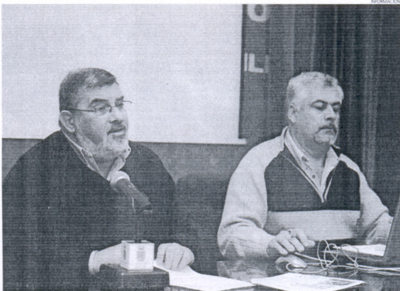
La delegación de Consumo y la OMIC han ido informando puntualmente de los trámites y pasos a seguir.

Todas las solicitudes de Ayudas al Gobierno presentadas en la OMIC se encuentran registradas en la Subdelegación del Gobierno en Cádiz, que es el organismo competente en este caso; de la misma forma, que las solicitudes pre-