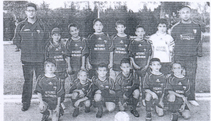
La Roteña A benjamín se mantiene en lo más alto de la clasificación del grupo 3.