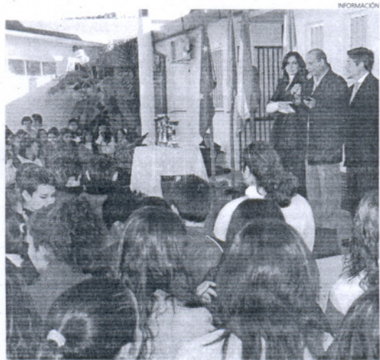
Con estas charlas los alumnos comprenden mejor la Constitución española.

Según el calendario previsto por la Delegación de Educación, distintos concejales de los distintos grupos municipales que componen la Corporación se repartirán por los ocho centros que participan en esta celebración.