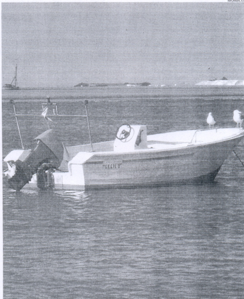
A través de las medidas anunciadas, el río Guadalquivir permanecerá controlado a través de las cámaras del SIVE.