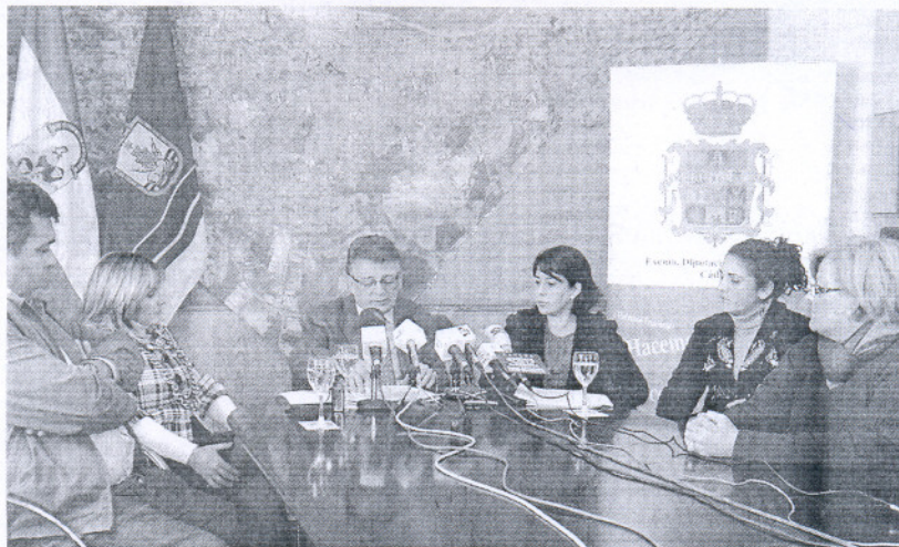
El presidente de la Diputación, acompañado de los alcaldes de Sanlúcar y Trebujena, junto a otros cargos.

Buena parte de las inversiones previstas pertenecen al ámbito de la iniciativa denominada Cádiz 2012 Compite, que se desarrollará a través de tres programas plurianuales: uno de "desarrollo local y urbano", otro llamado Plan Integral de Empleo, y un tercero con el nombre Cádiz, Origen de las Culturas. En cuanto al primero, contiene casi 4,5 millones de euros para la comarca, en concreto para los municipios de menos de 50.000 habitantes. Así, por ejemplo, en Rota se construirá "un centro educativo para niños de temprana edad"; en Chipiona, "se ejecutará un proyecto de rehabilitación y equipamiento de la escuela de hostelería en el edificio San Fernando"; y en Tre-