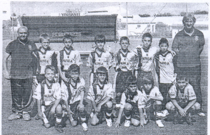
Los benjamines del Fútbol Vejer A dejaron presente su poderío con una goleada.