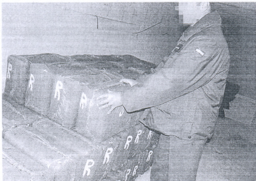
Fardos de hachís de un cargamento incautado en Sanlúcar en las mismas fechas que el de Rota.

El Tribunal Supremo estima, en contra de lo que consideró la Audiencia, que los indicios que relacionan a los procesados con el desembarco son muy débiles