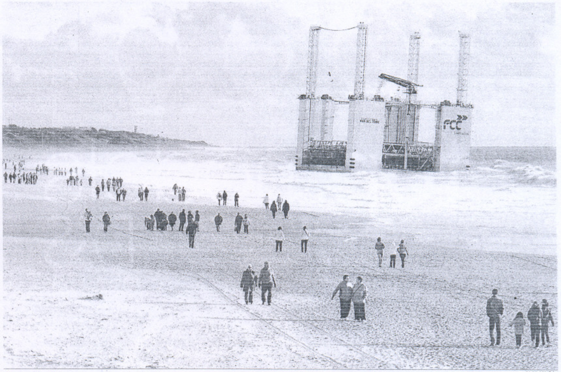
Cientos de chichlaneros y vecinos de la Bahía se acercaron ayer nuevamente a La Barrosa para ver el dique varado desde el fin de semana.

El dispositivo que ha presentado la firma transportadora -cuyo nombre no ha sido facilitado- se compone de tres buques remolcadores y un protocolo que garantiza la viabilidad y la "máxima seguridad" de la maniobra. "Se va a contar con todos los medios necesarios y con los recursos que hagan falta para llevar a cabo la operación", remarcaron las mismas fuentes empresariales. En principio, el desencallado de este muelle flotante no parece complicado porque se encuentra en plena orilla, en una zona arenosa y no rocosa, y en un espacio abierto amplio que facilita la movilidad. Como estaba previsto