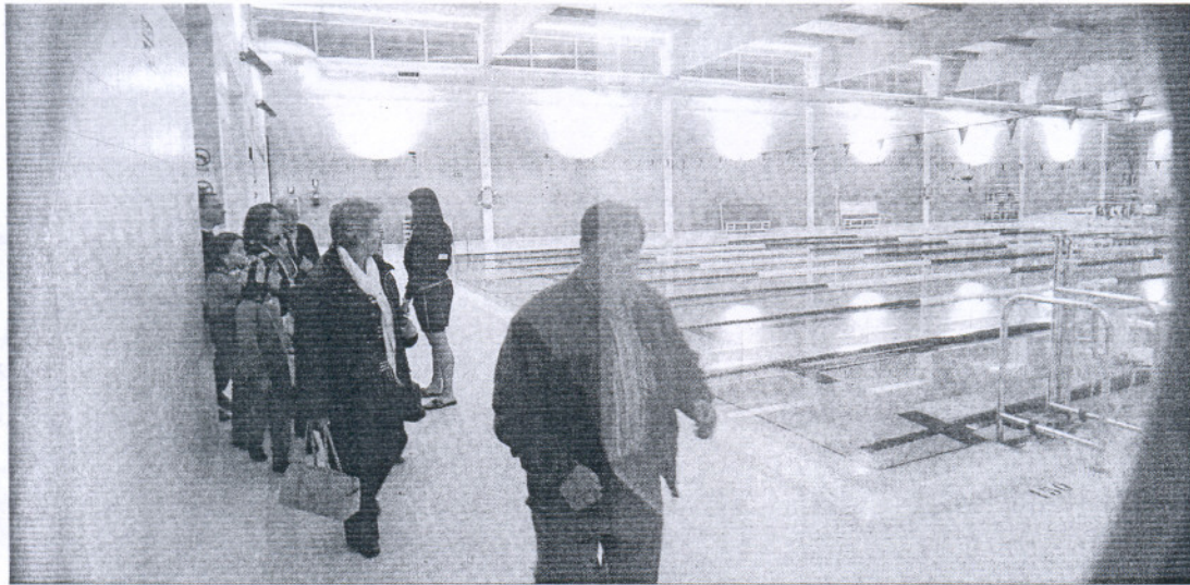
La piscina cubierta de Rota, ayer, totalmente preparada para su apertura al público mañana.