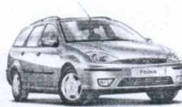
Ford Focus Wagon