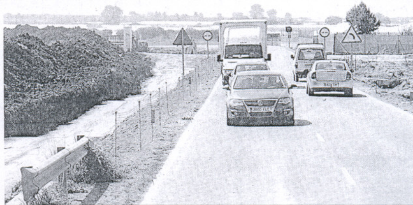
La carretera de Munive, en una imagen de archivo, antes de ser remodelada.

Hasta el lugar del accidente se trasladaron agentes de la Guardia