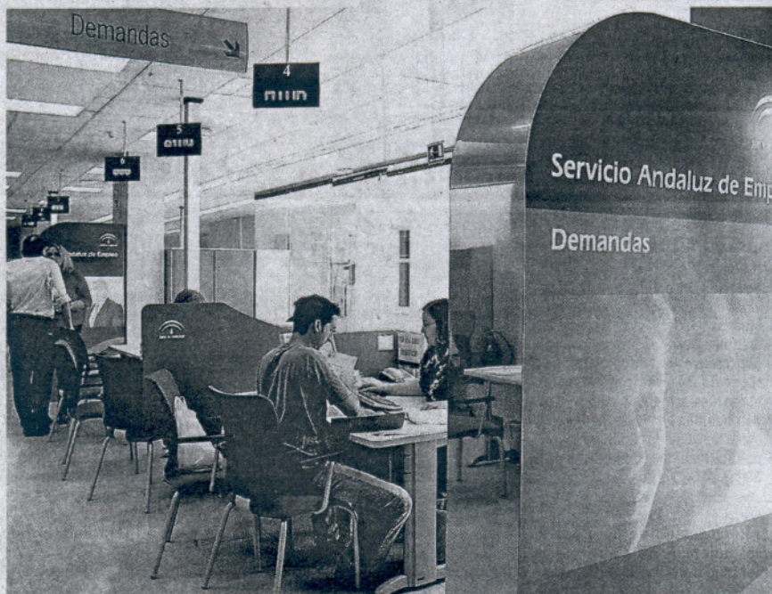
DEMANDA. Ex empleados de Delphi, en las oficinas de empleo de Jerez en octubre.

Otro partido de la oposición que criticó el «maquillaje» de los datos del paro fue el PSA, quien