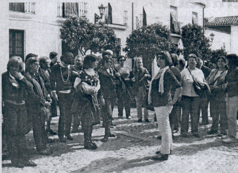
El objetivo de este viaje era crear un entorno de convivencia entre hombres y mujeres.

Así, una vez en Ronda, los participantes pudieron conocer a través de una visita guiada la Iglesia