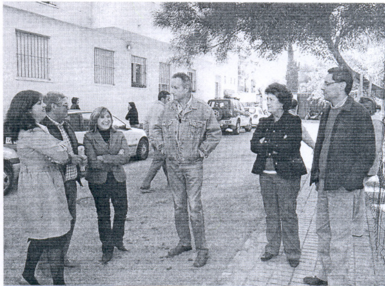
La alcaldesa, ayer con vecinos de la Huerta del Desengaño, donde se invertirán más de 400.000 euros.