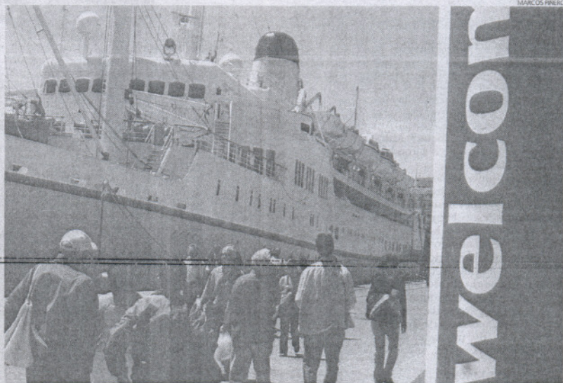
La provincia de Cádiz obtiene las peores valoraciones de Andalucía en los entornos urbanos y los paisajes.

Las playas y la asistencia sanitaria son los dos únicos puntos en los que Cádiz ha obtenido las calificaciones más altas de la región, aunque compartiendo tal honor con otras provincias. Sólo Málaga y Granada, precisamente dos de las provincias que reciben más turistas, obtienen peores resultados globales que Cádiz. La provincia obtiene un 7 de media, la misma puntuación que los visitantes dan a Huelva, mientras que Málaga y