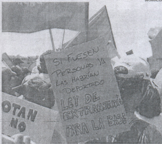
La manifestación saldrá a las 12.00 horas de la Plaza de la Costilla.

Según dijo, la marcha concluirá en la puerta principal del recinto militar, donde se procederá a la lectura de varios saludos, que protagonizará el escritor Juan José Téllez, el poeta Benjamín Prado, la Plataforma Andaluza contra las Bases, representantes del Consejo de la Paz y ecologistas de Portugal y, probablemente, de una