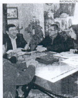
El alcalde ha prometido ayudarles.

de un nuevo emplazamiento, desde el que la Iglesia Evangélica de Filadelfia pueda seguir desarrollando su labor de integración social y cultural y que evite molestias a los vecinos.