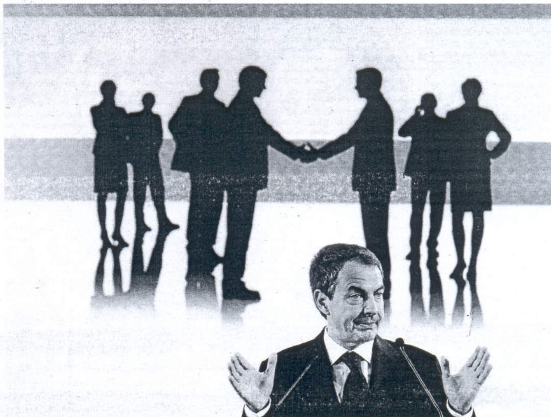
José Luis Rodríguez Zapatero, ayer, durante su intervención en el foro organizado por el semanario británico 'The Economist'.

Una subida que, de nuevo, Rajoy criticó por no ver en ella la solución para reducir el “insostenible” déficit. El líder del PP censuró una vez más la política económica del Ejecutivo, pero prefirió incidir en su “optimismo” en la recuperación, que se basa, dijo, en la capacidad de ajuste ante la crisis mostrada por las empresas y por las familias, no en un Gobierno que “no ha hecho los deberes” y se dedica a mandar “mensajes equivocados”.