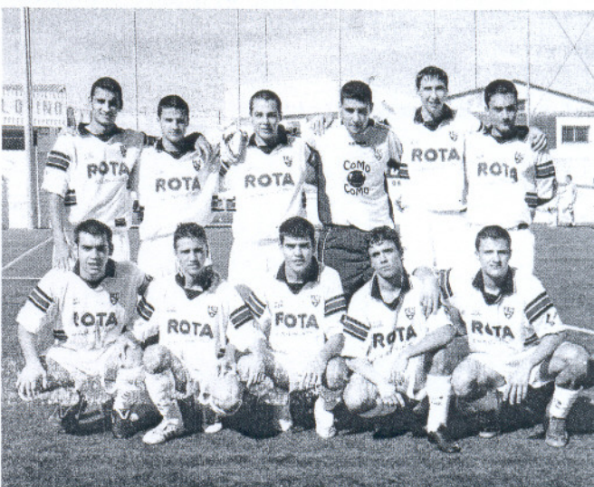
Los juveniles de la Roteña perdieron frente a un posible rival directo. SONIA RAMOS