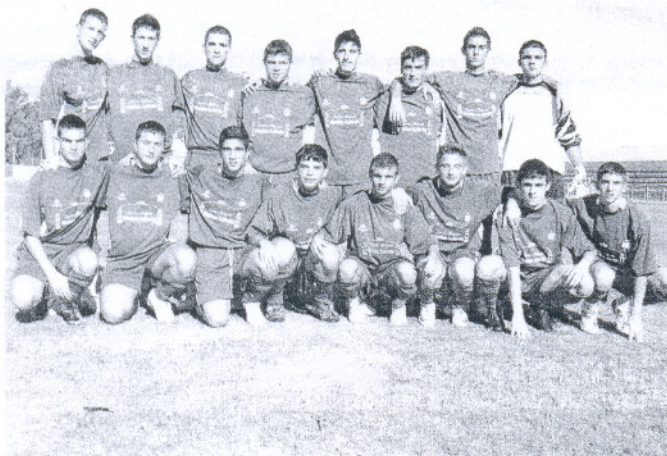
El San Marcos juvenil dejó escapar una buena ocasión para sumar los tres puntos. ANDRÉS MORA