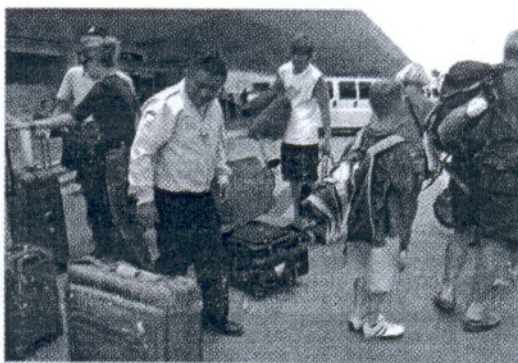
En octubre han registrado descensos las caídas del turismo.