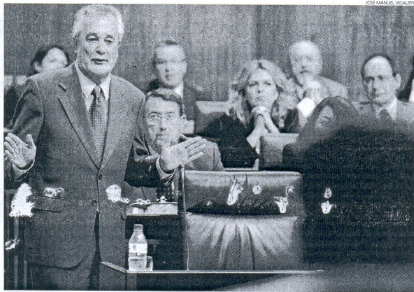
El presidente de la Junta, José Antonio Griñán, durante su respuesta a la intervención de Javier Arenas.

Griñán, que le recordaba a Valderas que los presupuestos aún no están cerrados, defendió que la Junta tire de endeudamiento para garantizar un presupuesto de crecimiento nulo pero con un