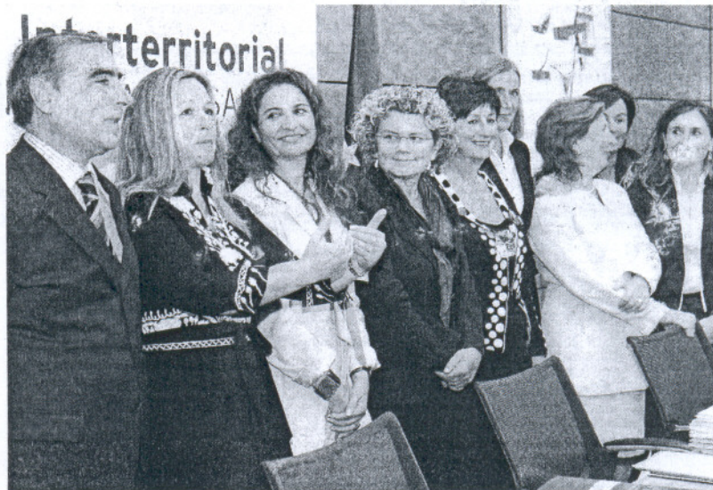
La ministra de Sanidad junto a los consejeros de Salud tras el Consejo Interterritorial.