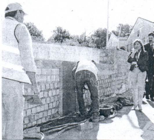
La alcaldesa visitó ayer los trabajos de remodelación de esta avenida.

La regidora sanluqueña subrayó que "además de la mejora del acerado y de la calzada para el tráfico rodado, que se mantendrá con una anchura de siete metros y dos carriles de circulación, el proyecto incluye la dotación de la red de saneamiento, que contará con un sistema separativo y un colec-