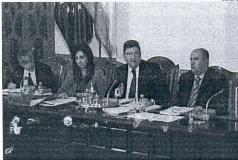
La moción presentada por el PP pretende hacer que lleguen más turistas al municipio así como a la provincia.

Asimismo, la ponente explicó que es necesario la mejora de las redes de comunicación provincial tanto por carretera como por fe-