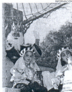
Los pajes acompañan a los Reyes.

dios de comunicación y que será supervisado por el secretario del Ayuntamiento. De igual modo, en ese sorteo se designará la carroza en la que irá situado cada paje.