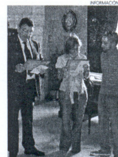
Se hizo entrega de un detalle.

Los representantes municipales recibieron gratamente este reconocimiento por parte del grupo scout, y transmitieron a su responsable su agradecimiento por el detalle tenido con ellos y su deseo de mantener esta colaboración.