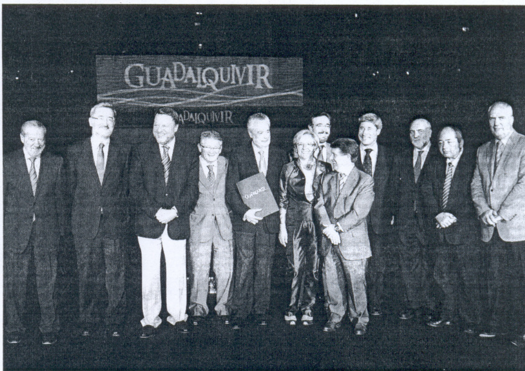
Foto de familia de los firmantes del protocolo del Proyecto Guadalquivir, con José Antonio Griñán en el centro, ayer en Sevilla.

Esas estaciones están incluidas en los tres grandes nodos en que se ha dividido el río: Nodo del Guadalquivir Alto (Ventana de la Sierra), Nodo del Guadalquivir de la