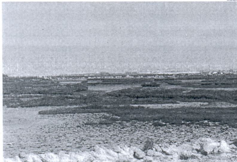
El Parque Natural de la Bahía se ve desde distintos prismas por parte de los políticos y ciudadanos.