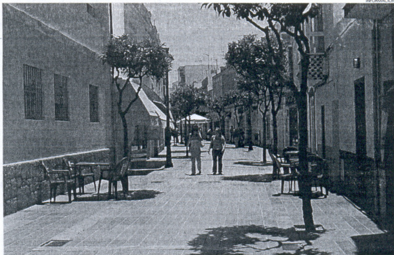
En las calles García Sánchez (en la imagen), y Charco, que la continúa, se encuentran numerosos comercios.

Para despejar dudas y aclarar rumores respecto a las posibles fechas de inicio de estas reformas, el delegado de Urbanismo, Jesús Corrales ha mantenido un encuentro con representantes de la Asociación de Empresarios, Comerciantes e Industriales de Rota (Aeciuro) para abordar la cuestión de las obras de mejora de estas calles, ambas incluidas dentro de un plan de rehabilitación de diversos espacios del casco antiguo de la localidad, el cual se ha iniciado ya en la plaza de San Roque. Sobre las dos calles peatonales, que aglutinan numerosos comercios de todo tipo, hace años que no se efectúa ni la más mínima actuación, y por ello desde el Consis-