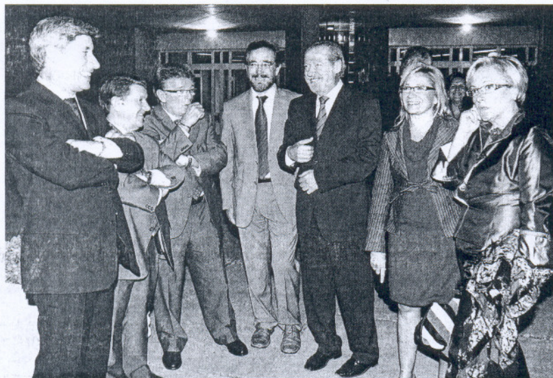
Los presidentes de las diputaciones implicadas en el proyecto.