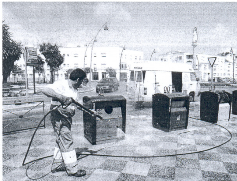
Los nuevos contenedores soterrados permitirán la recogida selectiva de residuos sólidos urbanos.