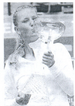
Azarenka besa su trofeo.