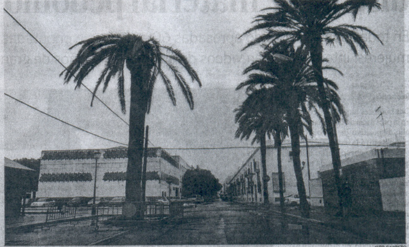
Palmeras deshojadas por el temporal en la avenida Menesteo, en El Puerto.