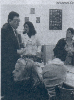
El primer edil con los alumnos.

agradeció a los alumnos y alumnas su invitación, les animó a seguir superándose y aprendiendo en la escuela de adultos Baifora, destacando su esfuerzo y dedicación a los estudios.