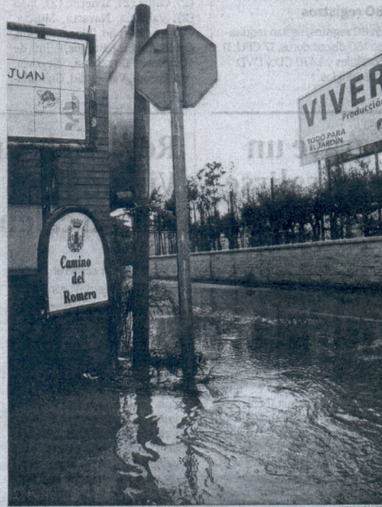
Aspecto de uno de los carriles de la zona de la Rana Verde, en Chiclana.