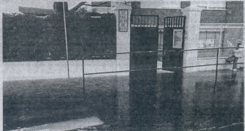
Los alumnos del colegio San Juan de Dios de Jerez no asistieron al colegio ayer por las inundaciones.

ceder al centro por idéntico motivo. Lo hicieron, al final, a través del anexo instituto Cortadura, sorteando los grandes charcos con plataformas improvisadas con tablones.