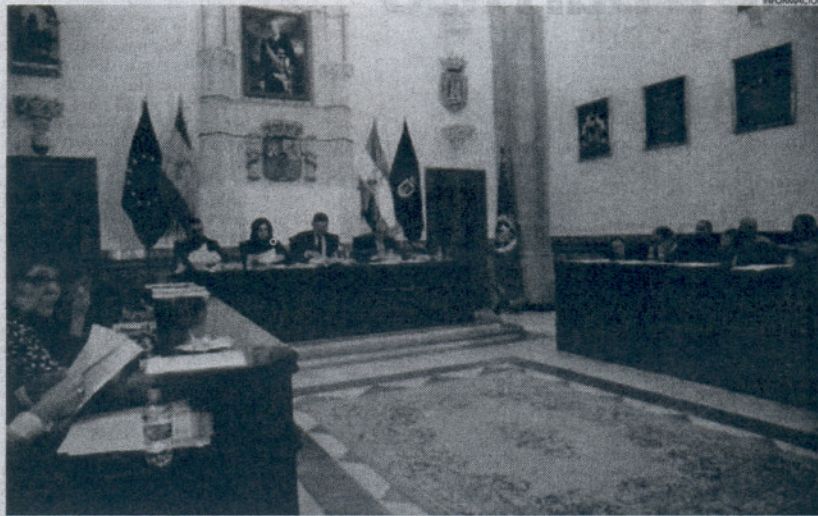
Para el PSOE, el sistema elegido por el equipo de Gobierno para desarrollar el polígono no es comprometido.

Según el acuerdo actual, el Ayuntamiento se quedará con el 20% de los terrenos urbanizados,