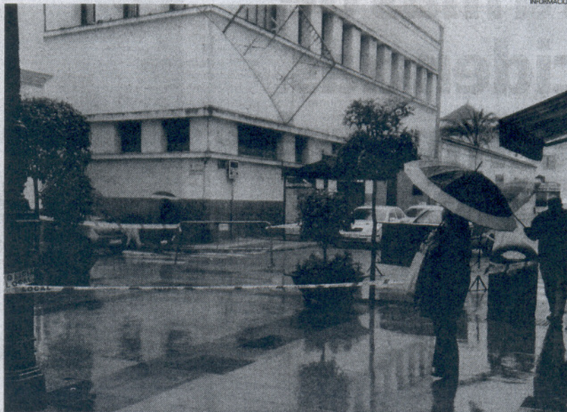
Imagen de las consecuencias del temporal en el municipio de Sanlúcar de Barrameda.

Día de intensa lluvia y fuerte viento el que se vivió ayer en la capital gaditana, aunque sus consecuencias no se tradujeron en percances de importancia afortunadamente. La Policía Local tuvo que efectuar un total de siete actuaciones, todas ellas por inundaciones en bajos y en viviendas en las calles Feduchy, Santo Domingo de la Calzada, Cristóbal Colón, Mariana Arteaga, Cristo de la Misericordia, Conil (bajos del estadio Carranza) y en la entrada al colegio de Cortadura. También el fuerte viento ha producido incidencias, como caída de cascos en las calles Isabel La Católica, Antonio Machado y Magallanes. Además, la lluvia provocó un accidente, con heridos leves en la Avenida Ana de Viya, entre un ciclomotor y un camión. Las previsiones para hoy no son muy halagüeñas y la Agencia Estatal de Meteorología advierte de lluvias de hasta 80 litros por metro cuadrado hasta las 12 horas.