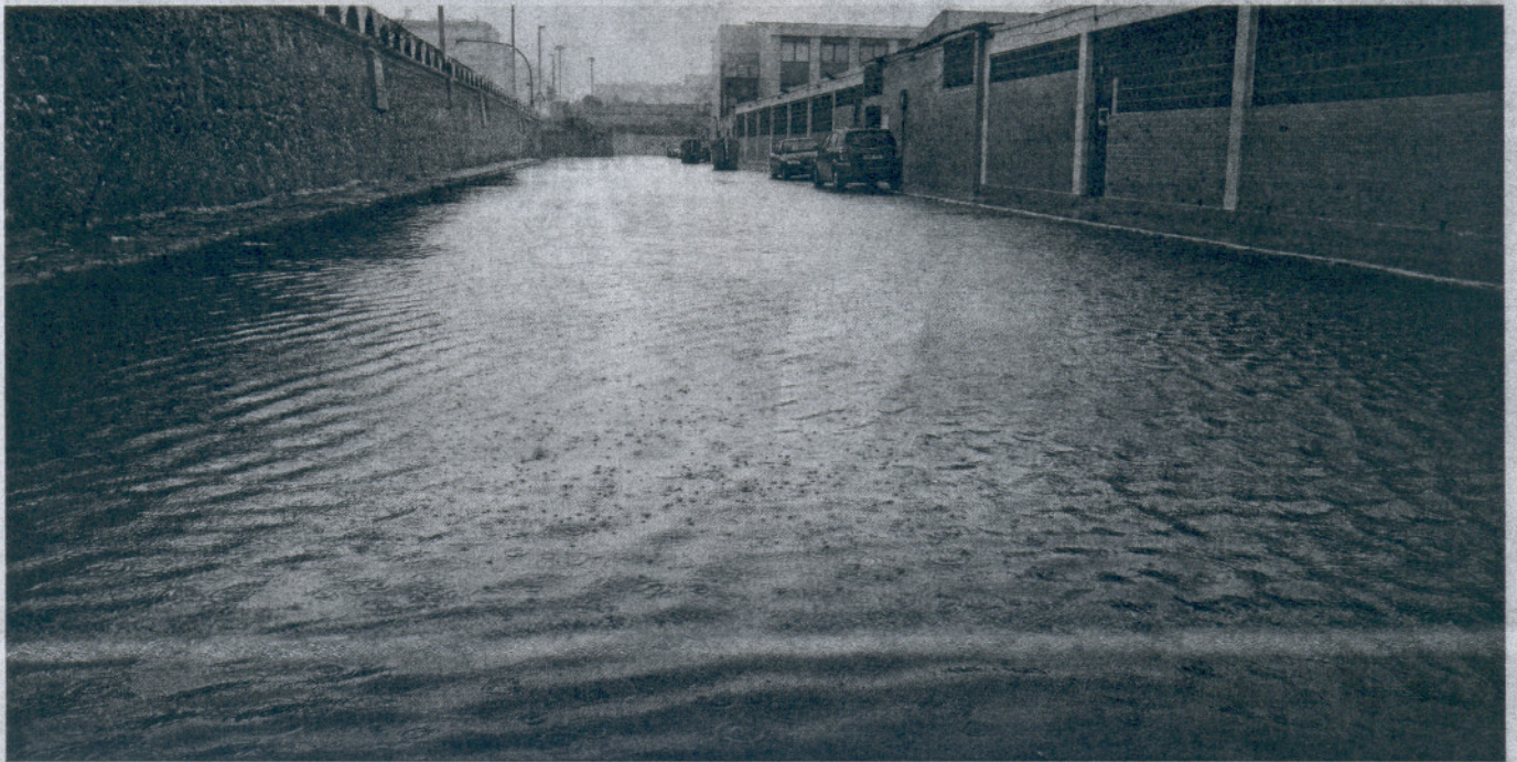
La inundación del acceso al colegio La Inmaculada de Cádiz provocó problemas para los alumnos, que entraron en el centro a través del instituto anexo.