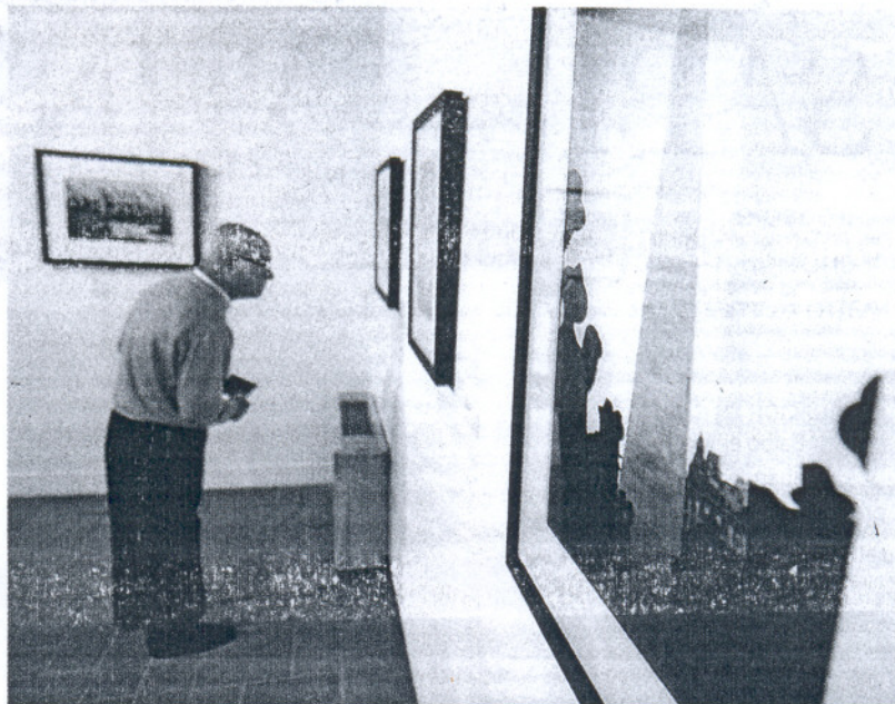
Un visitante observa uno de los cuadros de la exposición inaugurada ayer en Santa Catalina.

La exposición, compuesta por 59 instantáneas y cuatro pelícu-