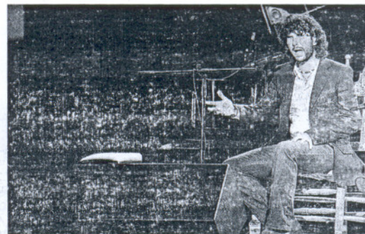
ARTE. Arcángel también actuará en Sevilla y Huelva. /L.V.

«Bueno, no me merezco tanto, pero esto viene a desmentir la frase evangélica de que nadie es profeta en su tierra», dice humildemente el autor de títulos como Rumor oculto , «Mientras cantan los pájaros», «Antiguo muchacho» o «Antes que el tiempo acabe», y que estos días ha abierto las puertas de su casa para que lo visitantes puedan apreciar todos sus recuerdos. Entre ellos, los cuadros que él mismo pintó. «Como pintor soy muy malo, pero la pintura siempre ha estado ligada a la poesía. La poesía es nutre de lo visual. Y mi poesía es ante todo pintura que entra por los ojos», dice el poeta.