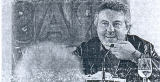
CONFERENCIA. El autor en la Biblioteca Provincial.

La biografía, organizada como se fuera una gran entrevista, sin un orden cronológico marcado, revela el inicio de su vida en el Sáhara español (con pasajes duros como el encarcelamiento de su padre por ser «rojo» y el suicidio de su madre); su afición al submarinismo (colaboró con Jacques Costeau) o el trabajo como corresponsal en varias guerras africanas (vivió 20 años en el continente) y latinoamericanas. El libro también aborda su éxito como creador de best-sellers ( La ruta de Orellana o Saud, el Leopardo ) y su experiencia en el cine.