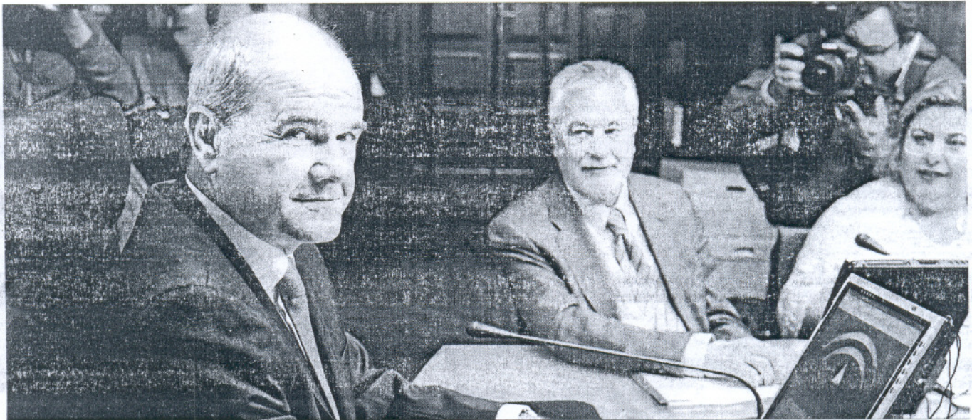
Manuel Chaves, en sus tiempos de presidente de la Junta, con José Antonio Griñán, entonces vicepresidente de Economía.