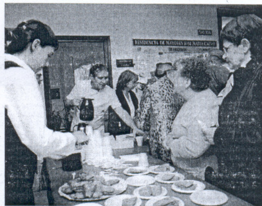
La Diputación mantiene su apuesta por la Protección Social.

En este sentido, la Diputación sigue reservando más de 15 millones de euros para asistir determinados gastos corrientes de los municipios; una asignación que