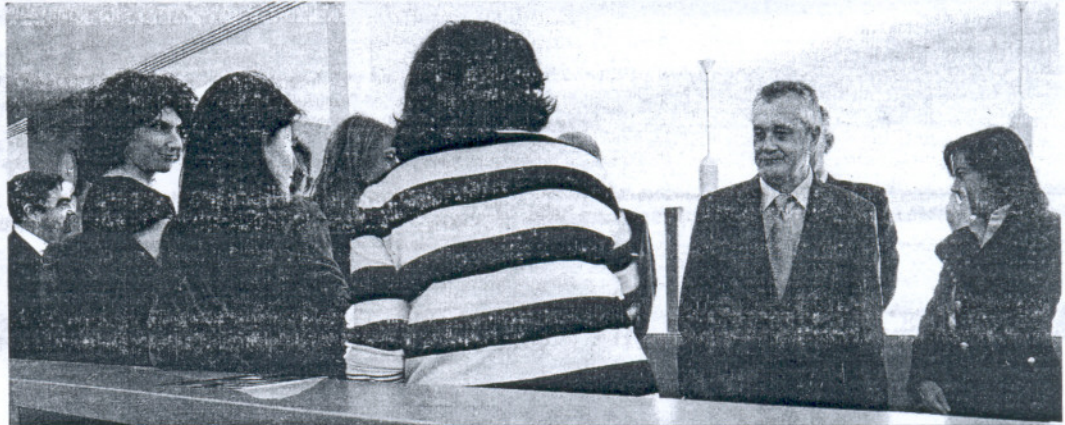
José Antonio Griñán conversa con algunas funcionarias en su visita ayer a las nuevas dependencias judiciales de Puente Genil.

El PSOE debe tomar decisiones muy delicadas sobre sus candidaturas a las alcaldías de determinadas ciudades, y el presidente de la Junta también quiere tener una voz determinante. Parece claro que en Huelva, donde los socialistas creen contar con mayores posibilidades de arrancarle el poder al PP, presentarán a la presidenta de la Diputación, Petronila Guerrero, o que en Córdoba, les gustaría que fuera el ministro de Exteriores, Miguel