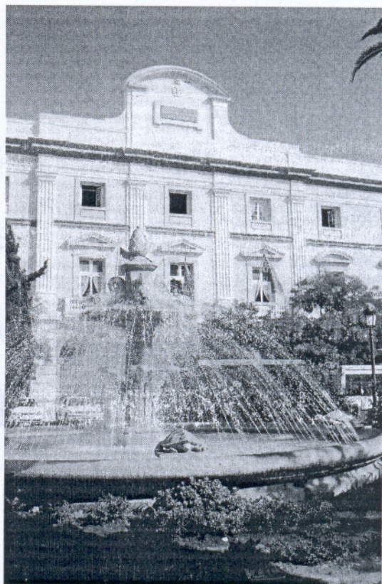
Fachada de la Diputación Provincial de Cádiz.

Otra partida relevante es la destinada al Consorcio de Bomberos de la Provincia de Cádiz, cifrada en 9 millones de euros. Una inversión necesaria para mantener un servicio especialmente efectivo, y es que en palabras del propio Francisco Menacho, "ningún municipio está a más de 25 minutos de alguno de los parques de bomberos", ha destacado Menacho, "sin que los Ayuntamientos de localidades con menos de 20.000 habitantes tengan que abonar nada".