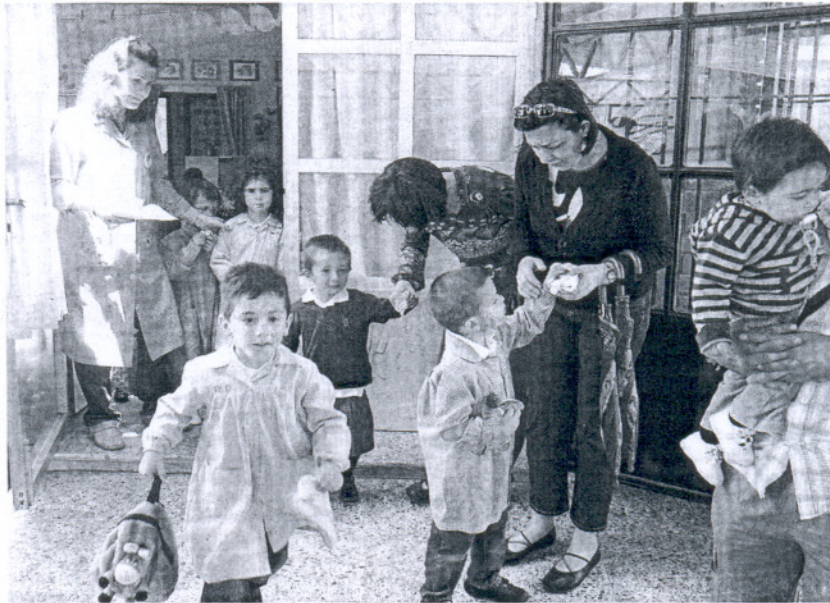
RECREO. Los niños podrán llevar productos de su casa para tomarlos en clase.

Eso no quita que los padres lleven al aula matinal una merienda como la del recreo. «La empresa puede disponer de un micro-