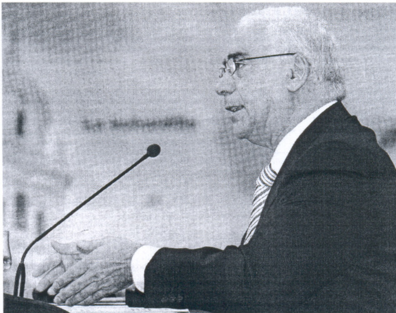
El Consejero de Turismo, Comercio y Deporte, ayer en Málaga.

Los dos meses claves del verano se saldaron con una caída tanto en el número de turistas como de pernoctaciones en la comunidad. En el primer caso, llegaron a Andalucía 3.298.970 viajeros, lo que supuso un descenso del 4,6% respecto al mismo periodo del año anterior. Las pernoctaciones—nú-