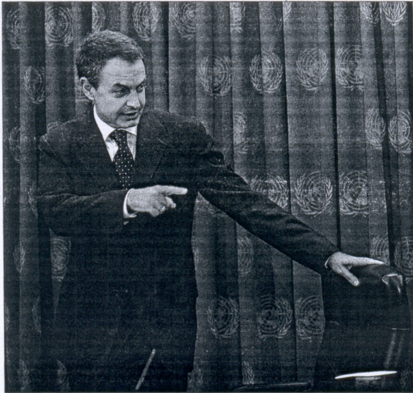
El presidente del Gobierno, José Luis Rodríguez Zapatero, en la sede de Naciones Unidas.

"Hay Gobiernos que suben impuestos y lo ocultan y otros que dicen que los bajan y no es cier-