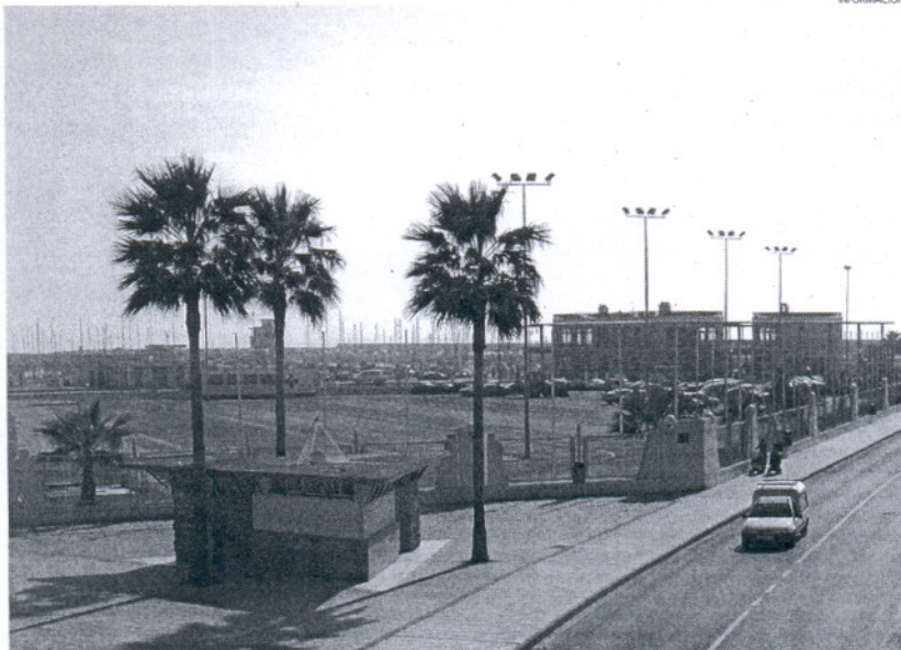
Las edificaciones que se encuentran dentro del perímetro del puerto están sujetas también al pago del IBI.