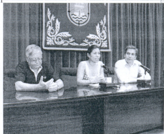
La delegada de Cultura anunció la reapertura de los cines de la Villa.