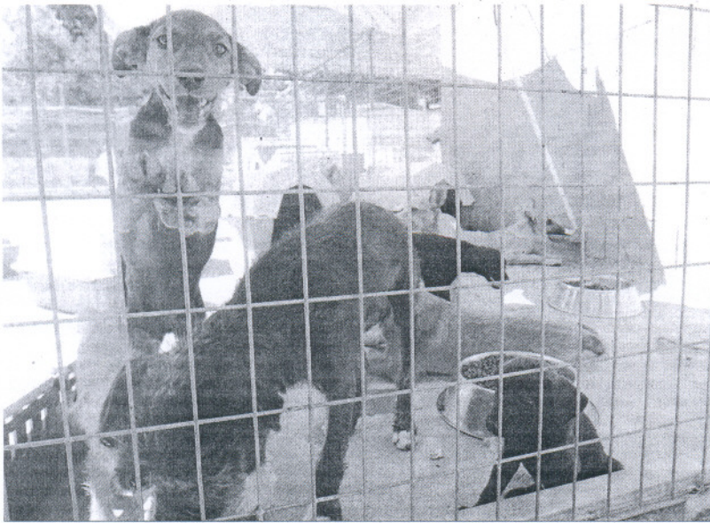
Animales en una de las perreras de la provincia.