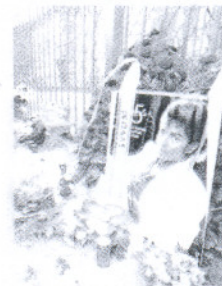
Las ofrendas se multiplican.

Fans de todo el mundo lloran la muerte de Michael Jackson