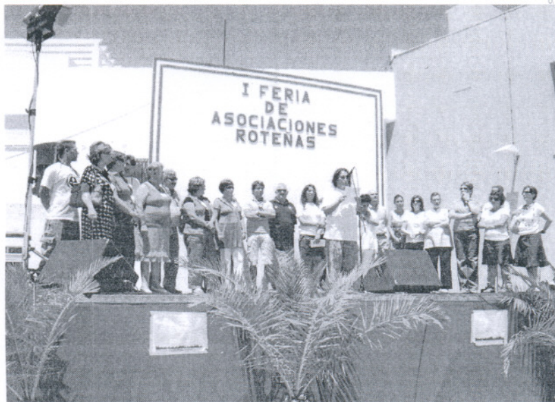
Casi veinte asociaciones participan en esta muestra en la que sus trabajos se darán a conocer a los visitantes.