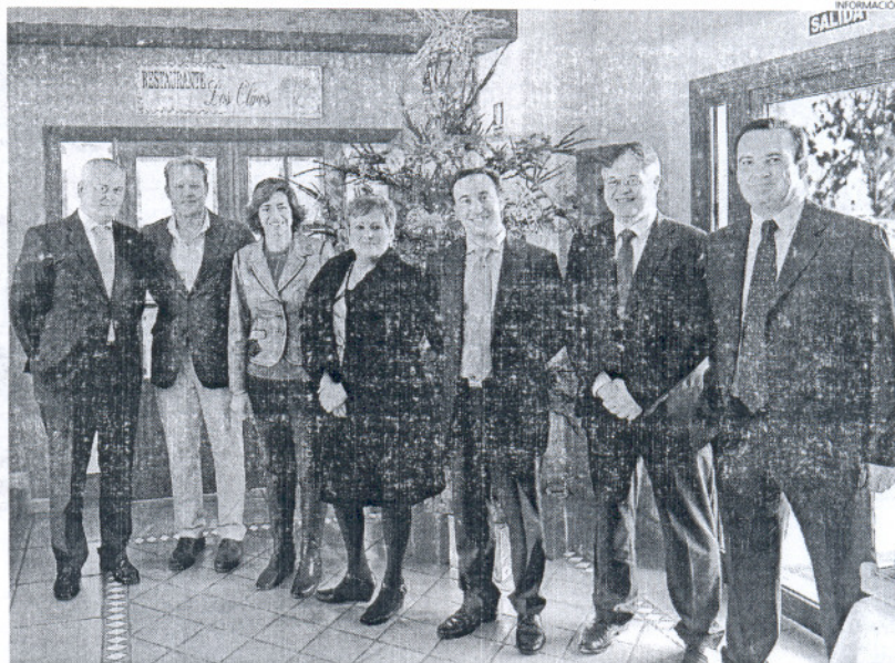
La Fundación de Turismo y los directivos hoteleros de la localidad fijan objetivos comunes en estas reuniones.

Igualmente, se realizó una valoración de los datos de ocupa-