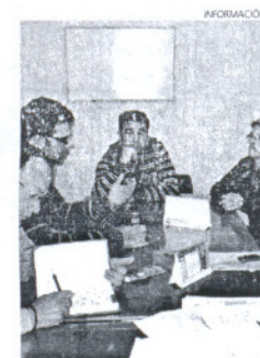
El objetivo es potenciar el centro.

El objetivo de todas estas iniciativas es el de dinamizar el centro comercial de la localidad para atraer a los ciudadanos a la hora de realizar sus compras navideñas sin optar a salir del municipio.