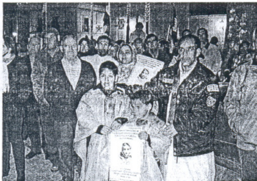
Un momento del encuentro solidario convocado el martes en Trebujena.

En Sanlúcar, la Asociación de Amigos del Pueblo Saharaui La Jaima celebró el martes por la tarde una concentración solidaria de decenas de personas en la céntrica Plaza del Cabildo y explicó ayer públicamente su respaldo a la causa en una rueda de prensa