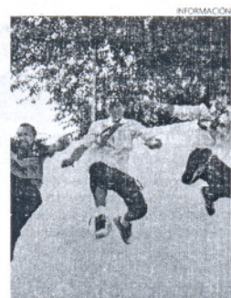
La banda toca en casa el viernes.

Los interesados en acudir al concierto, que tendrá lugar el viernes día 18 de diciembre, podrán adquirir sus entradas al precio de tres euros en la taquilla del auditorio municipal.