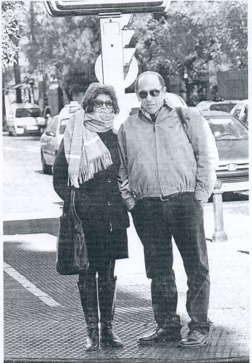
Los jerezanos tuvieron que abrigarse ayer por el notable descenso de las temperaturas. ■ CRISTÓBAL

Además de desempolvar prendas casi olvidadas, este temporal previsiblemente tendrá otras repercusiones de carácter sanitario, energético o de consumo. La gripe A ha provocado este año que los centros hospitalarios adelanten su plan de alta frecuencia, que consiste en una serie de pautas de organización para hacer frente a un aumento de las urgencias por procesos asociados a gripes y catarras. Si lo habitual es que estas instrucciones se lleven a cabo a primeros de diciembre, este año ya se trabaja con estas directrices desde octubre. La Red Nacional de Vigilancia Epidemiológica ha detectado en las últimas semanas un descenso en la actividad gripal; una tendencia que puede verse alterada por completo con un tiempo que ha pintado de blanco a buena parte del país. Si se cumplen las previsiones, el frío siberiano se alejará a partir de mañana.