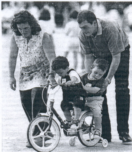
Una pareja ayuda a sus hijos a montar en bicicleta. :: LA VOZ

Según la encuesta, hecha entre febrero y marzo de este año, los andaluces valoran su situación económica particular con 6,93 puntos de media, algo mayor con 7,08 en las áreas metropolitanas (centros regionales) y menor en la costa (6,81) e interior y montaña (6,7).