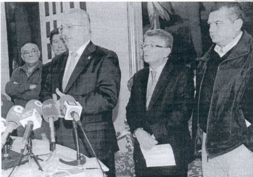
El consejero de Empleo volvió a mostrarse confiado en desbloquear el proyecto industrial "pronto".

Según dijo, los datos suministrados garantizan que los terrenos de Las Aletas, en Puerto Real, son "el único sitio posible para instalar este parque", por lo que consideró que el TS "tendrá que reconocer" que es "el único territo-