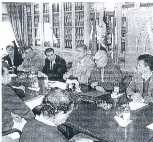
Un instante del encuentro, que se celebró en el Ifapa de Chipiona.

Los integrantes de la Mesa de la Flor Cortada por las organizaciones agrarias UPA, COAG, Asaflor, Asociaflor y Faeca suscribieron "el preámbulo de la constitución de la interprofesional, un ente en el que estará aglutinado el sector productivo y comercializador de