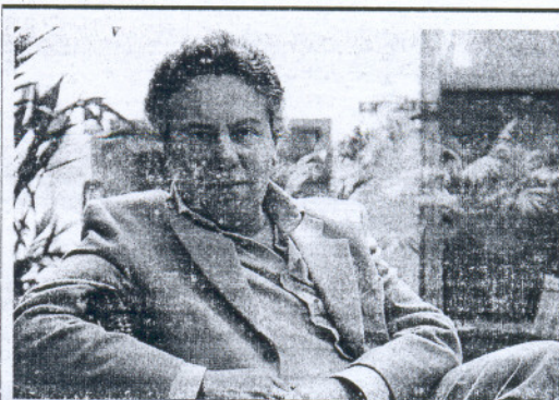
El escritor Felipe Benítez Reyes.

De esta forma, Poemas a toda plana pretende ser "un guiño a dos mundos habitualmente contrapuestos como pueda ser el de la poesía y el del periodismo, cuando a la prensa, a la radio, a la televisión y a las revistas digitales, hoy no sólo precisan de poesía sino de dignidad en su empleo y sus salarios, cuando las cifras de despedidos en los últimos meses contrastan con los beneficios que siguen acumulando buena parte de las empresas que