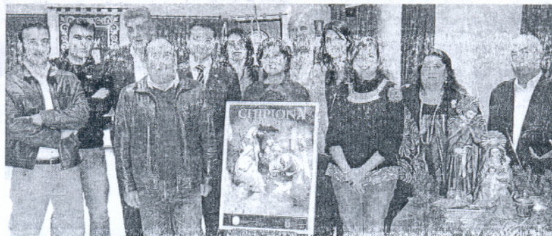
Los Reyes Magos posan con compañeros de cortejo y autoridades locales junto al cartel anunciador navideño.

Los tres fueron presentados como Majestades en un acto cele-