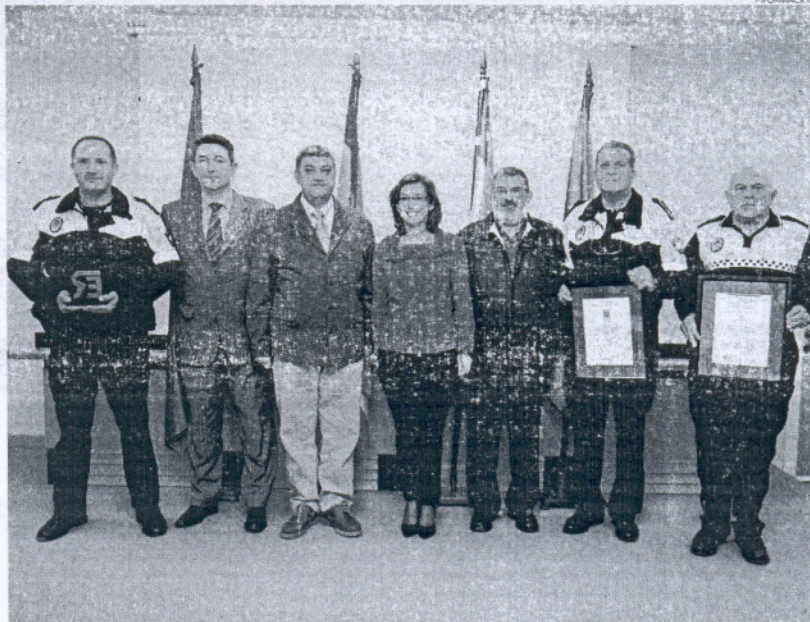
La Policía Local de Rota mantiene sus niveles de calidad, como lo acredita este certificado europeo de Aenor.

Según ha manifestado la delegada de Policía, la entrega del Certificado 1971/2006 según la normativa UNE-EN-ISO 9001 de AENOR a la Policía Local de Rota, "avala el más alto nivel de calidad