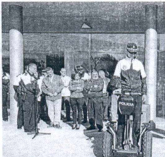
La Policía Local estrena estos días dos patinetes eléctricos para patrullar.