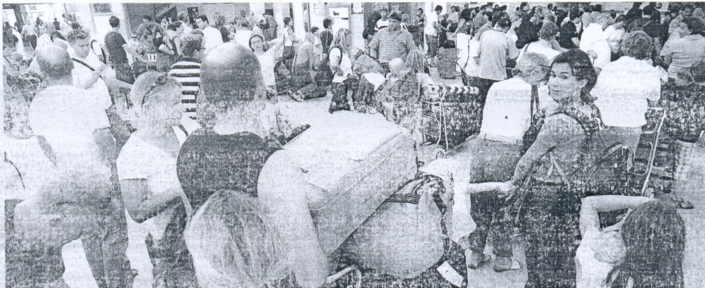
El aeropuerto recibirá a un buen número de turistas que se quedarán en Jerez o partirán hacia otras localidades de la provincia.