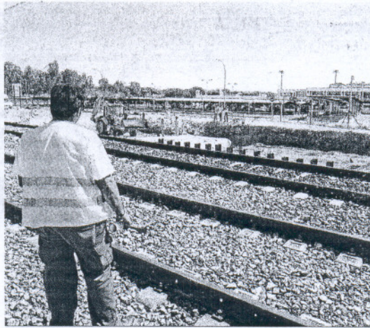
Obras de la vía férrea próximas al aeropuerto.

Para zanjar definitivamente el "rumor" que saltó en verano acerca de que el AVE pasaría de largo