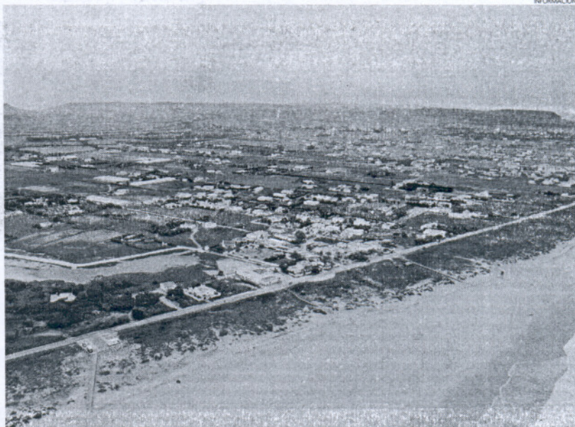
Vista aérea del litoral de la comarca de La Janda, afectado por el Plan de Ordenación Territorial.

El plan subregional de La Janda abarca los municipios de Alcalá de los Gazules, Barbate, Medinilla, Conil de la Frontera, Medina Sidonia, Paterna y Vejer de la Frontera. Para esta zona, se prevén actuaciones en materia de comunicación, con el objetivo de mejorar la articulación del ámbito con la Bahía de Cádiz-Jerez y con la Bahía de Algeciras, y en infraestructuras básicas, entre las que destacan las hidráulicas. Ade-